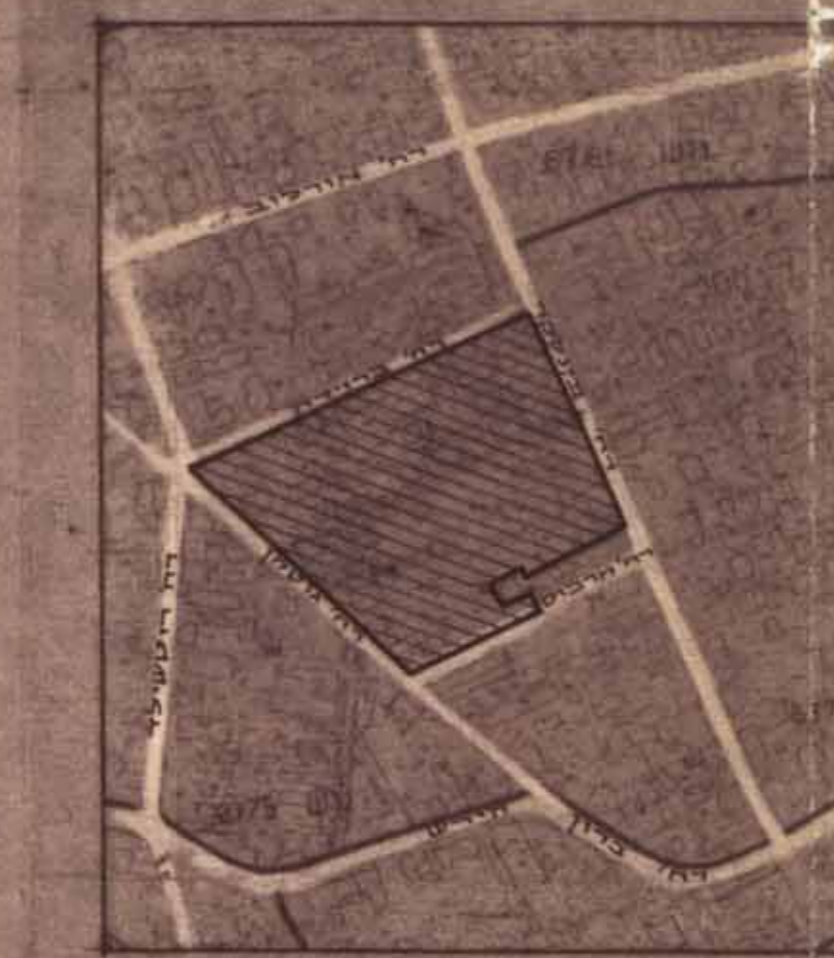
תרשים סביבה 1:5000