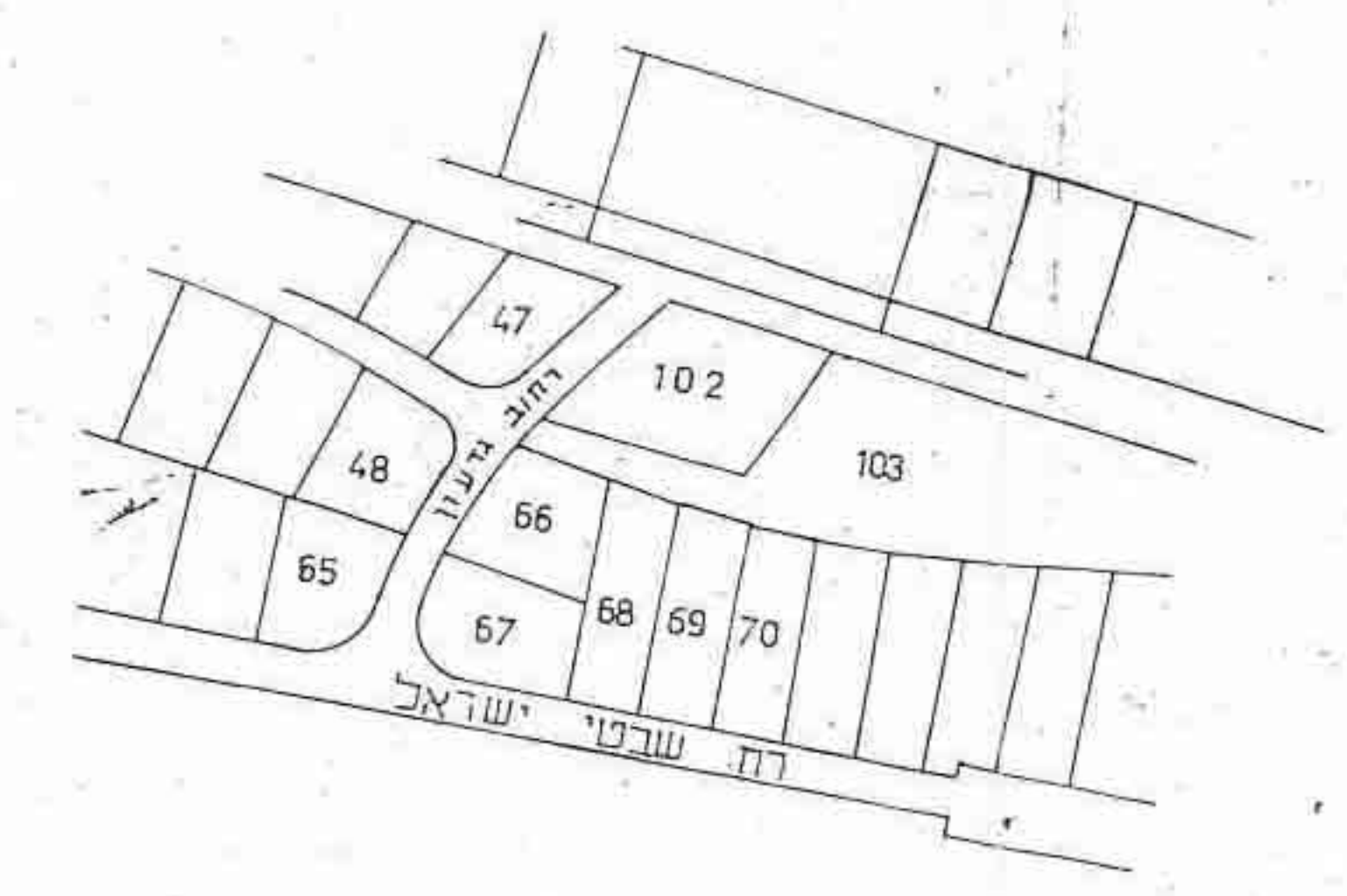
תרשים הסביבה ק.מ. 1:2500