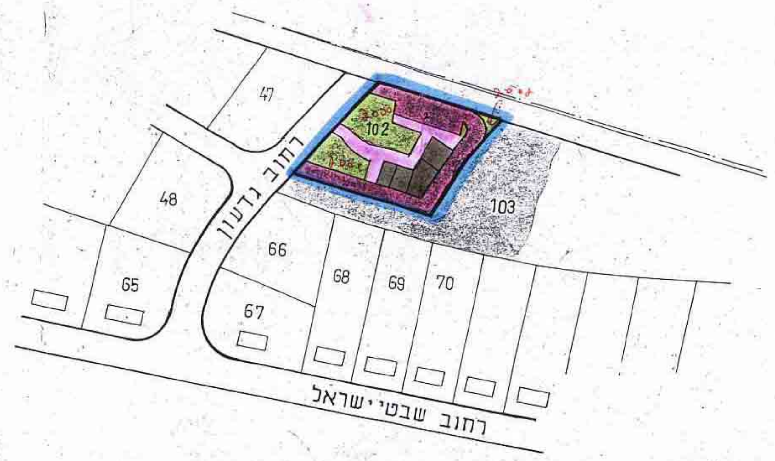
מצב מוצע ק.מ. 1:1250