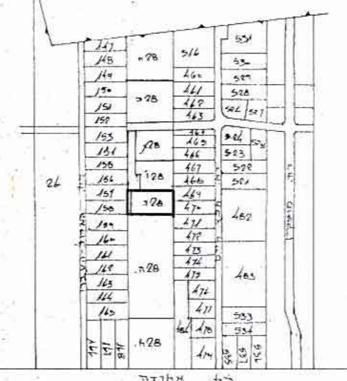
תרשים סביבה 1:5000