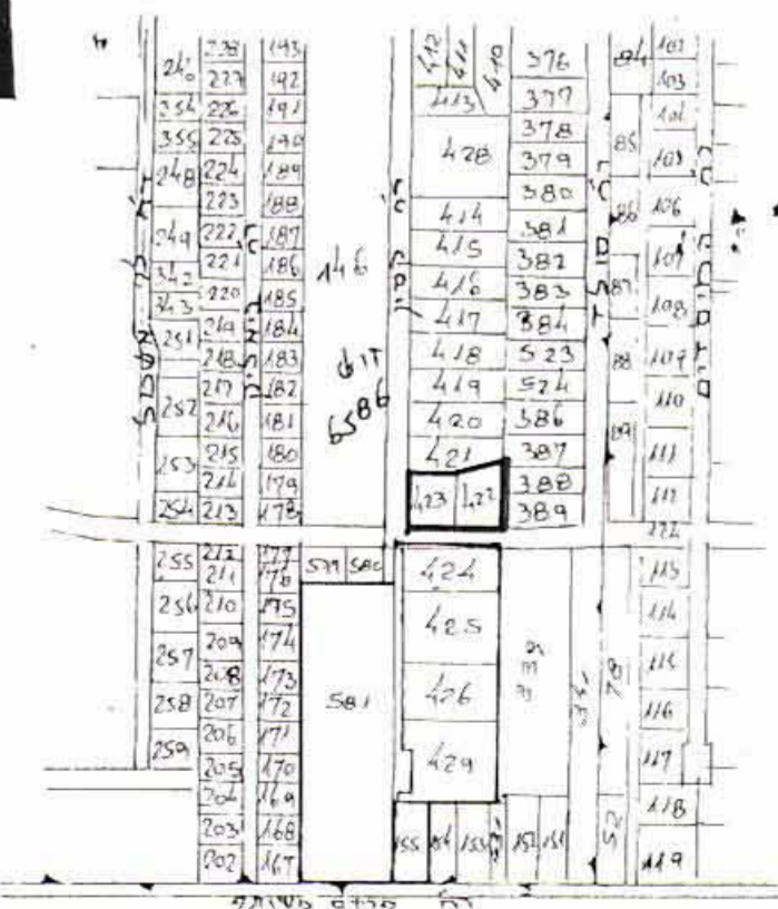
תרשים הסביבה 1:2500