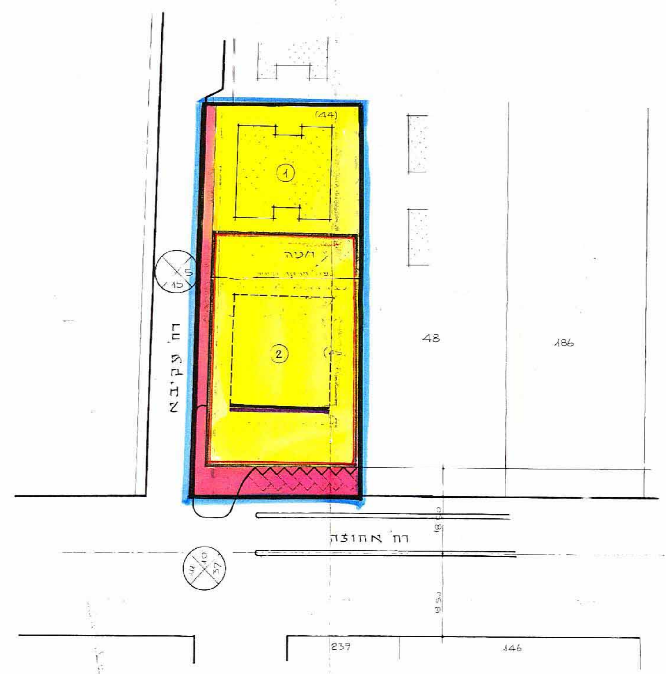
נוספ חדש ק.צ. 1:500