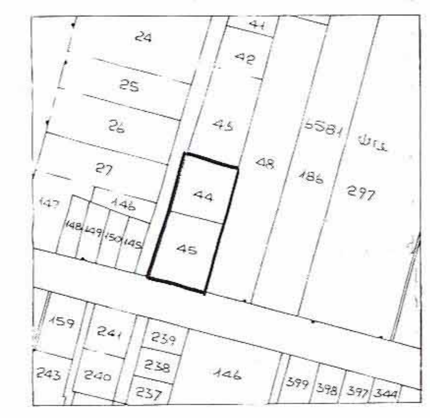
תדשים סביבה ק.צ. 1:2500