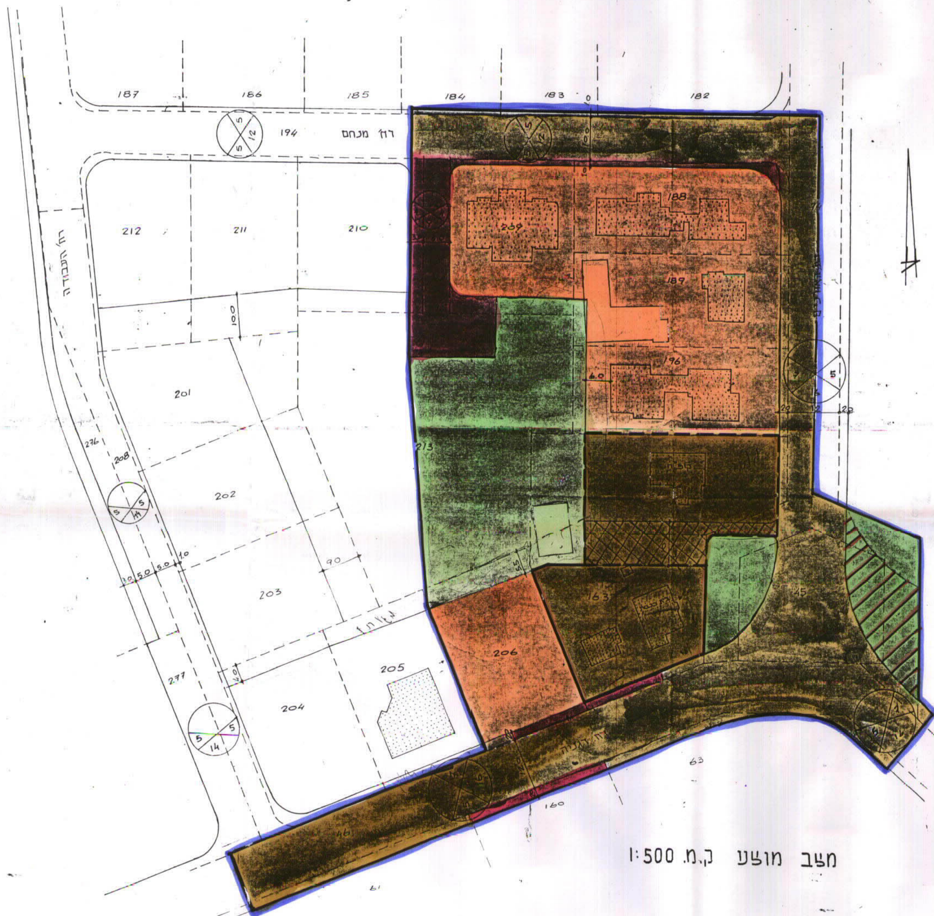
מצב מוצע ק.מ. 1:500

בתוקף עפ"י החלטת "המחוזית" בשיבתה מיום 22/9 מיום 6/1/88 תאריך 25/9/88