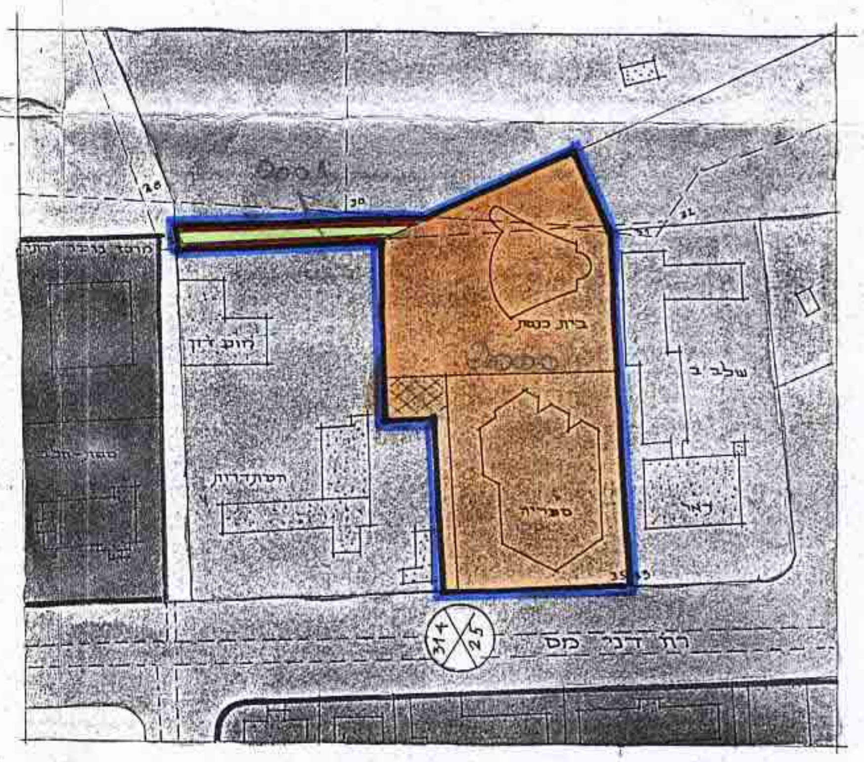
מצב חדש 1:1250