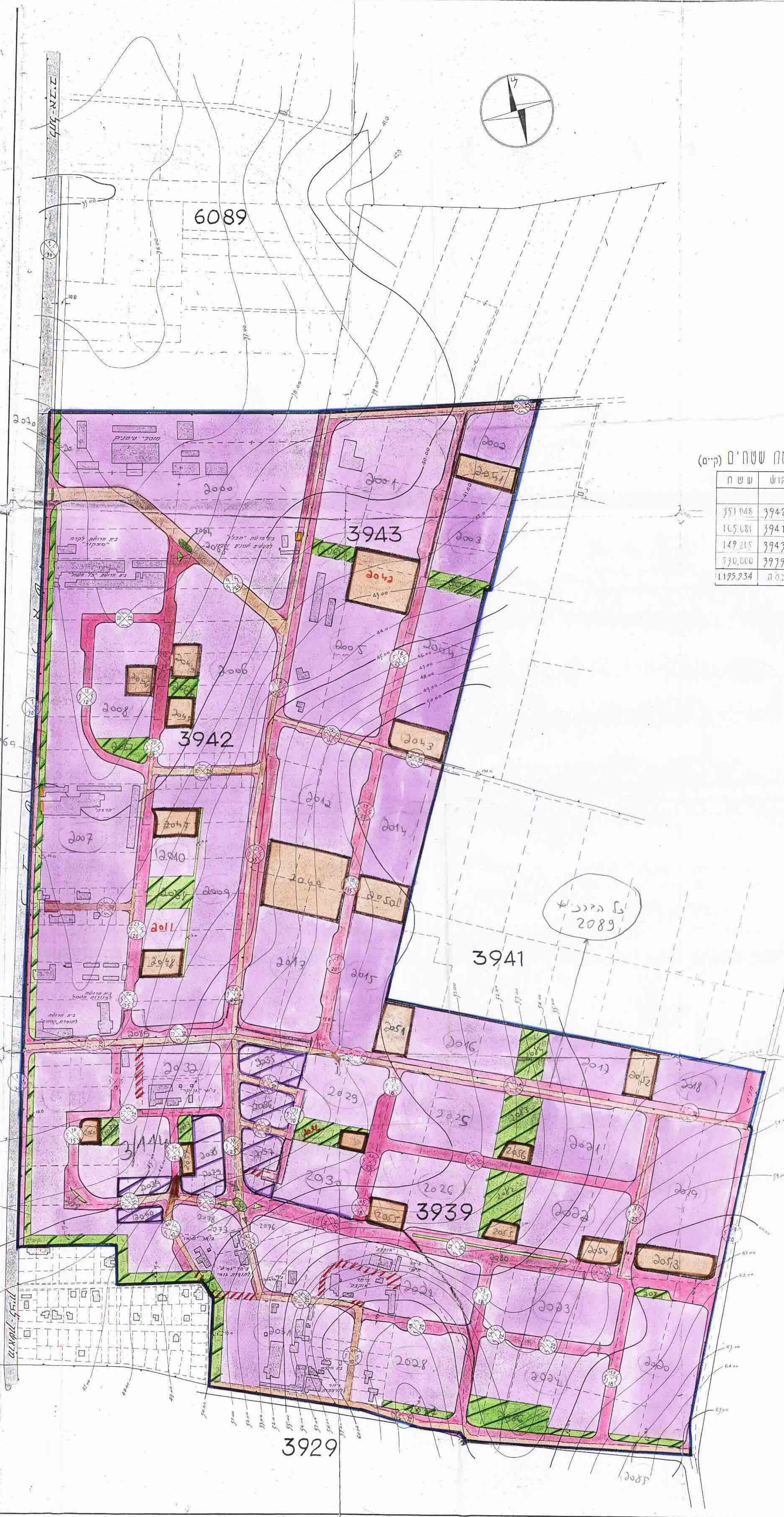
טוח שטחים (קיים)