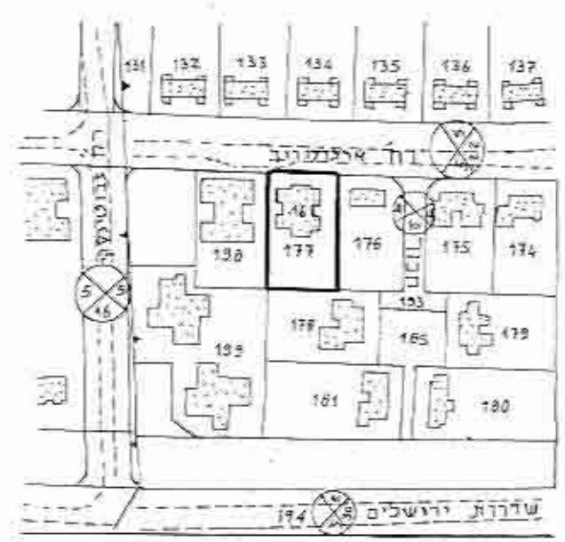
תרשים הסביבה 1:2500

חוק התכנון והבניה תשס"ה-1965 וידה בסיסית לתכנון והבניה לוד תכנית מס' לד/691 מס' 304.89 חתום אריה בן אליעזר מזכיר יושב ראש