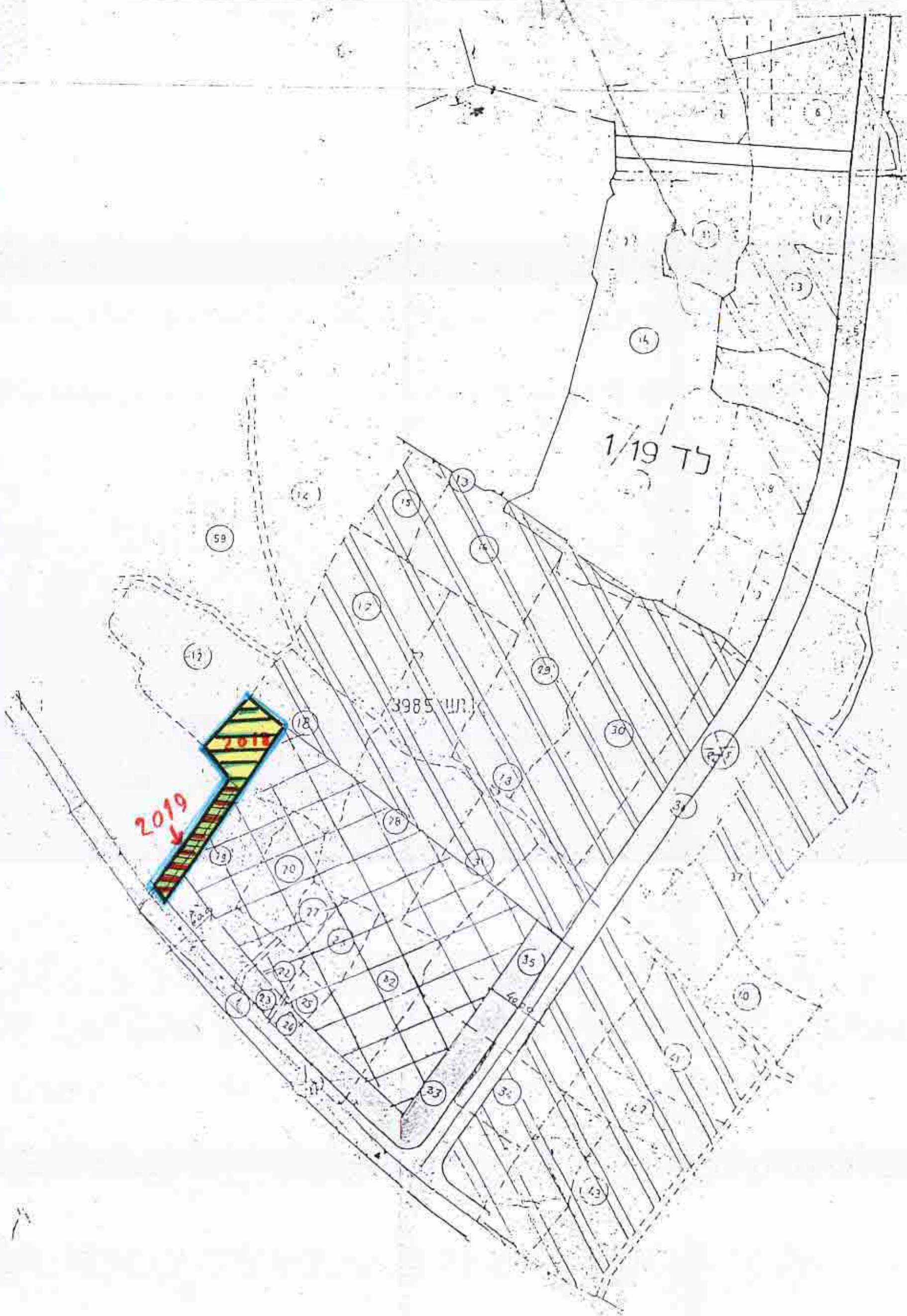
מצב מוצע 1:2500