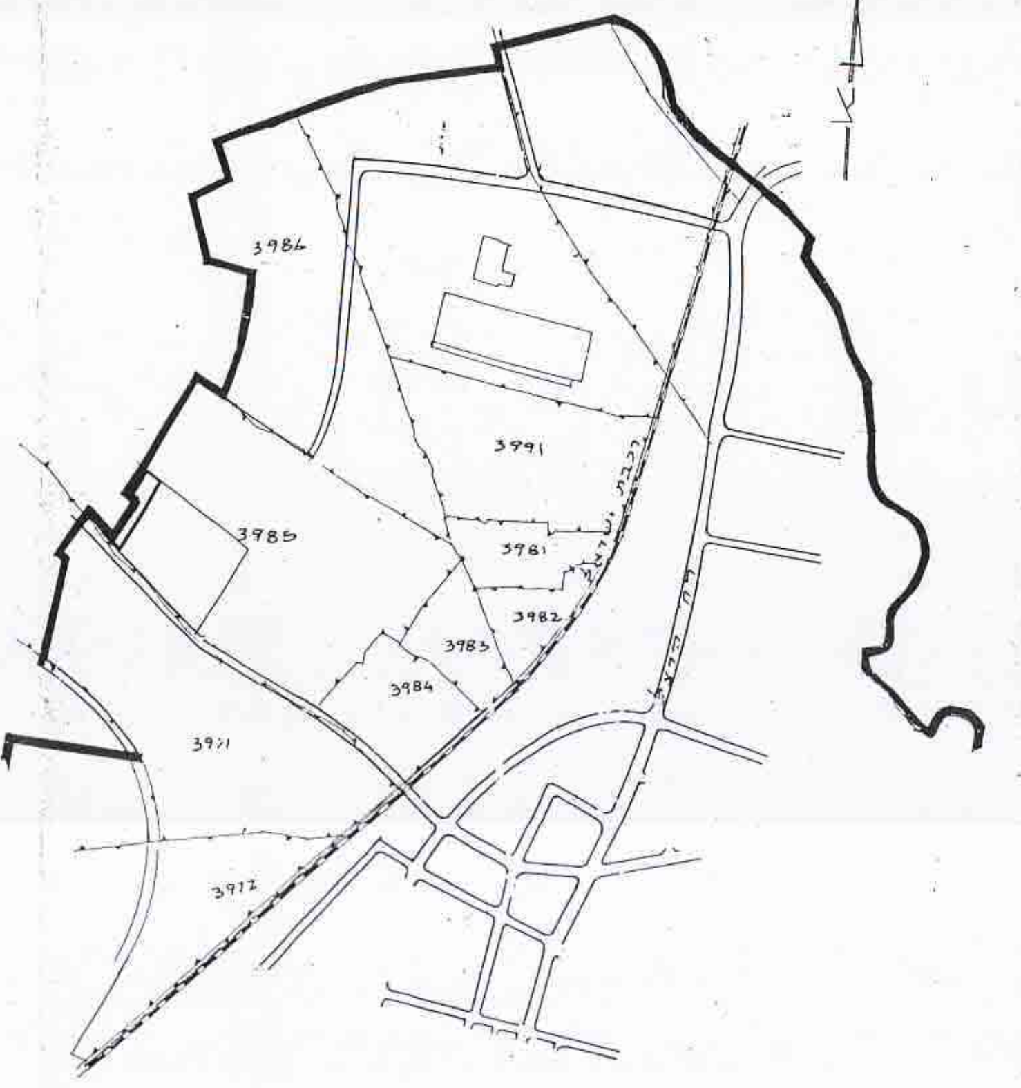
ונושים סביבה 1:10.000

חוק התכנון והבניה תשכ"ה-1965 וסדרת מקומיות לתכנון ולבניה לוד תכנית מפורטת מס' 111/1 מועד : 19.5.71 משרד הפנים מנהל תכנון ומרחב יושב ראש הוועדה