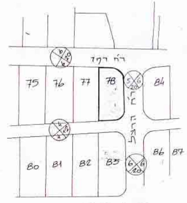
תלמי סביבה 1:2500

התכנון והבניה אדריכלים ת"א פריסטון 11 - תל. 229576 29.1.82