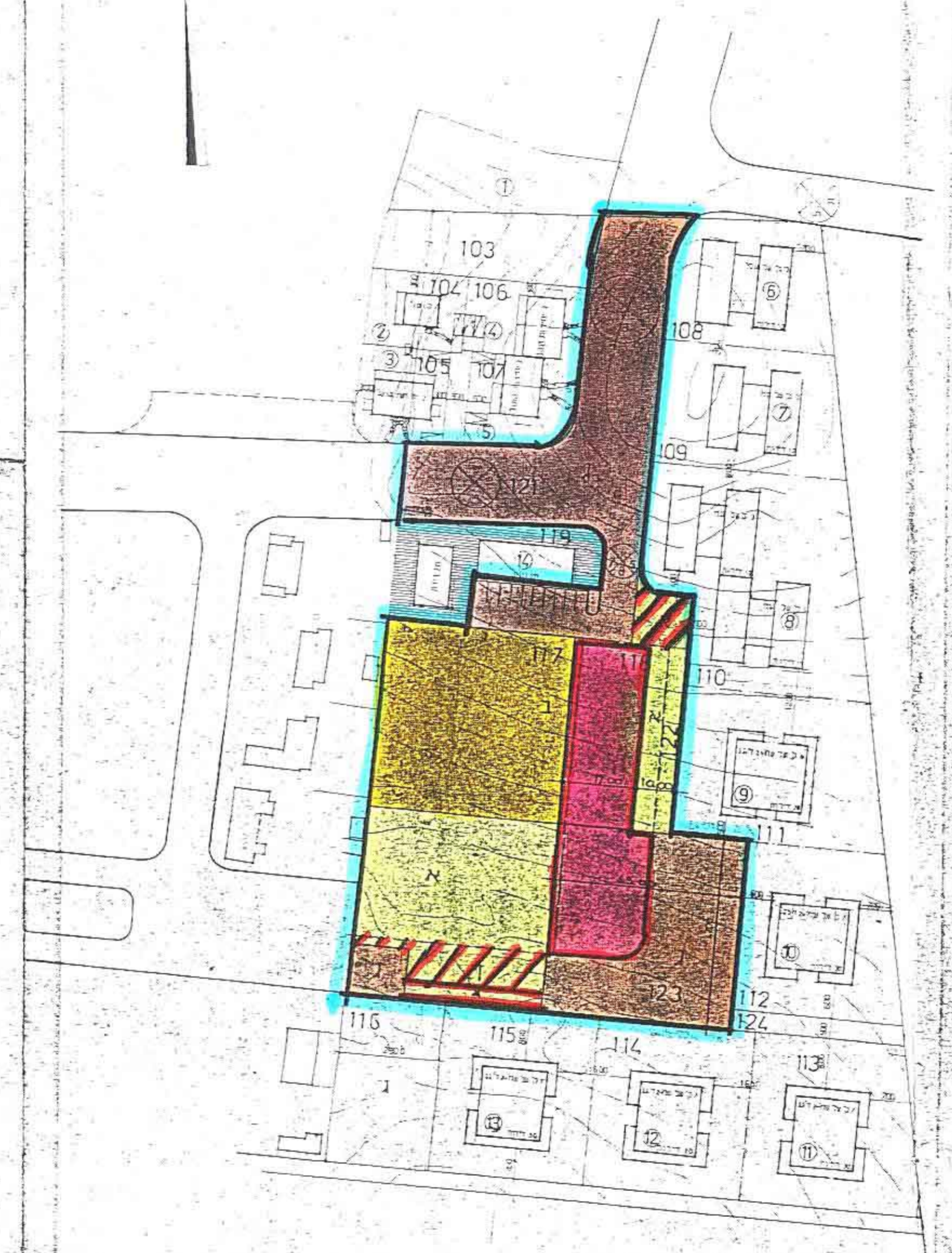
מצב מוצע נס/66/א ק.מ 1:1000