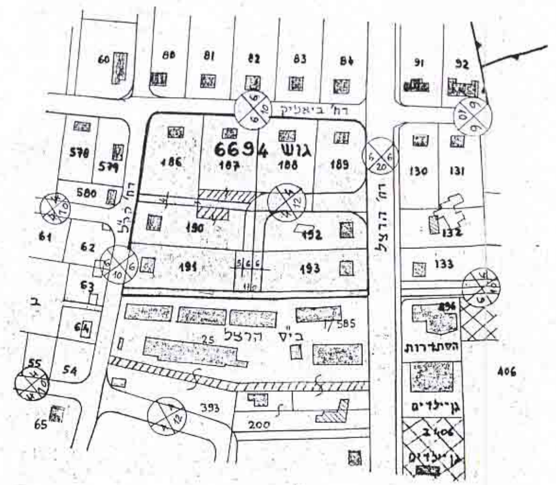
תרשים סביבה ומצב קיים לפי ממ/865+ממ/916-1:2500