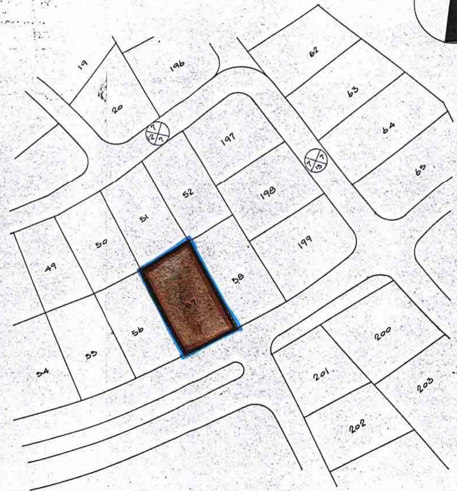
מצב סוצי 1:2500

מקרא גבול תכנית : איזור מגורים : שטח לבנין ציבורי :