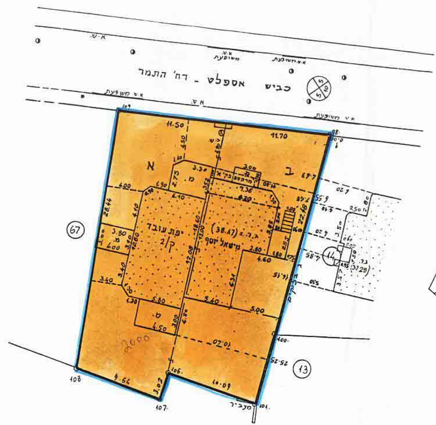
מצב חדש 1:250