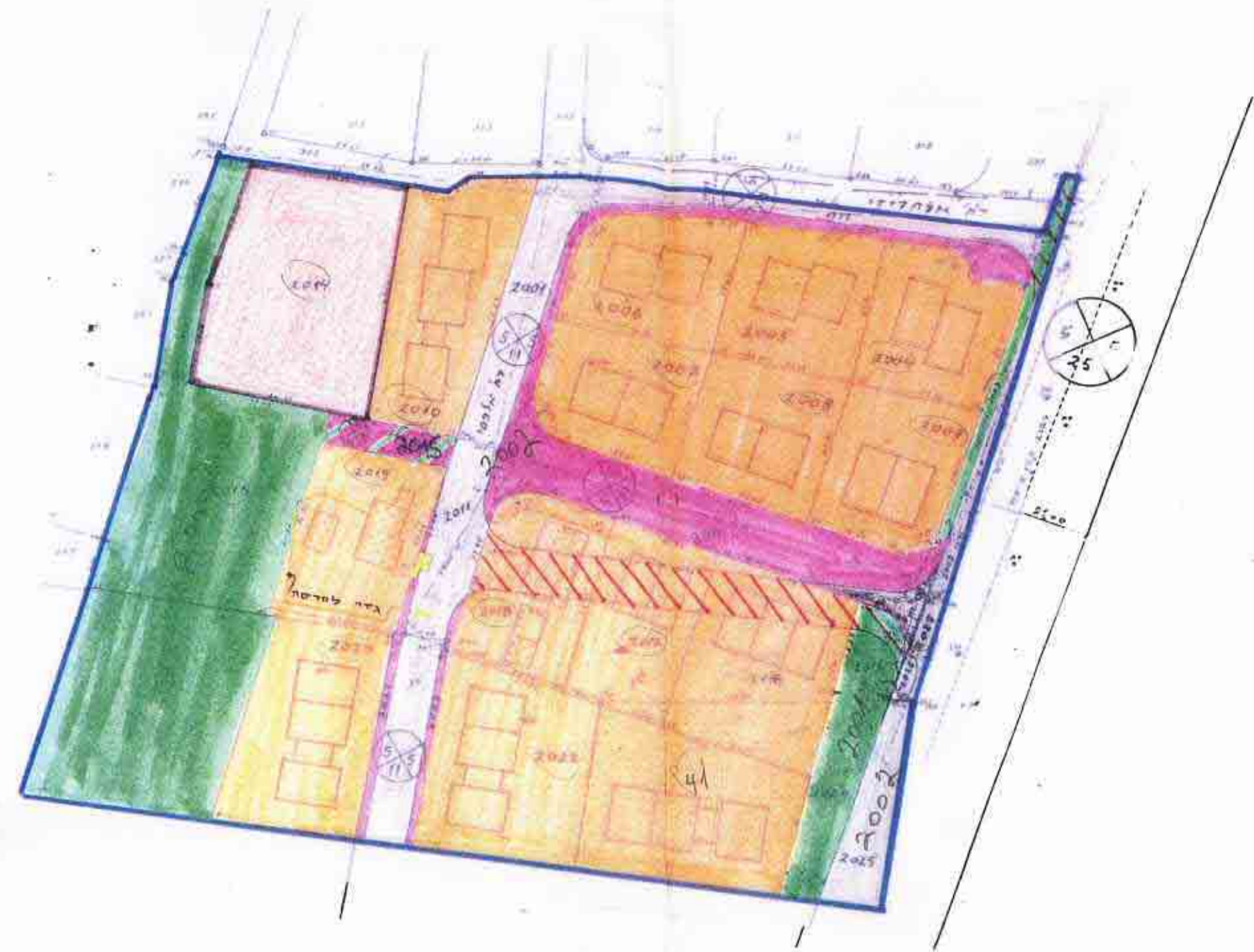
מצב מוצע ק.מ. 1:1000