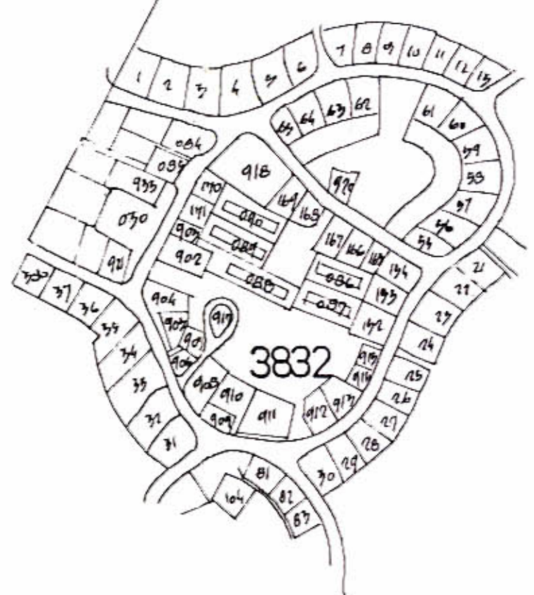
תרשים סביבה ק.מ. 1:5000