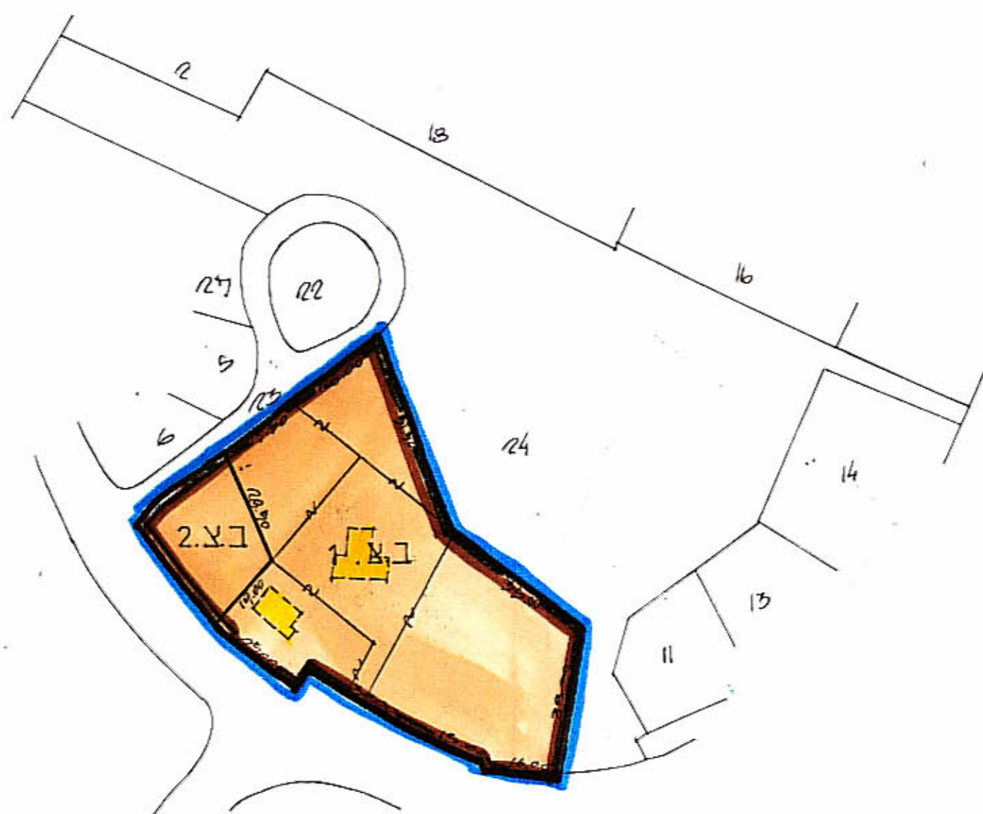
מצב חדש ק.מ. 1:1250