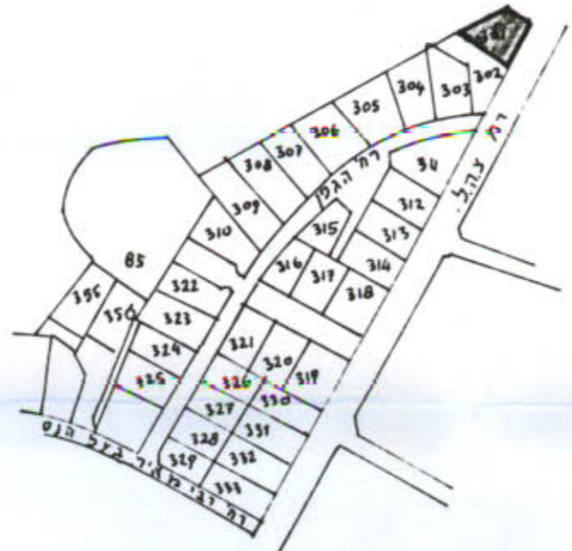
תרשים הסביבה 1:5000

חוק התכנון והבניה תשכ"ה-1965 הועדה המקומית לבניה ולתכנון עיר ה מ ר כ ז