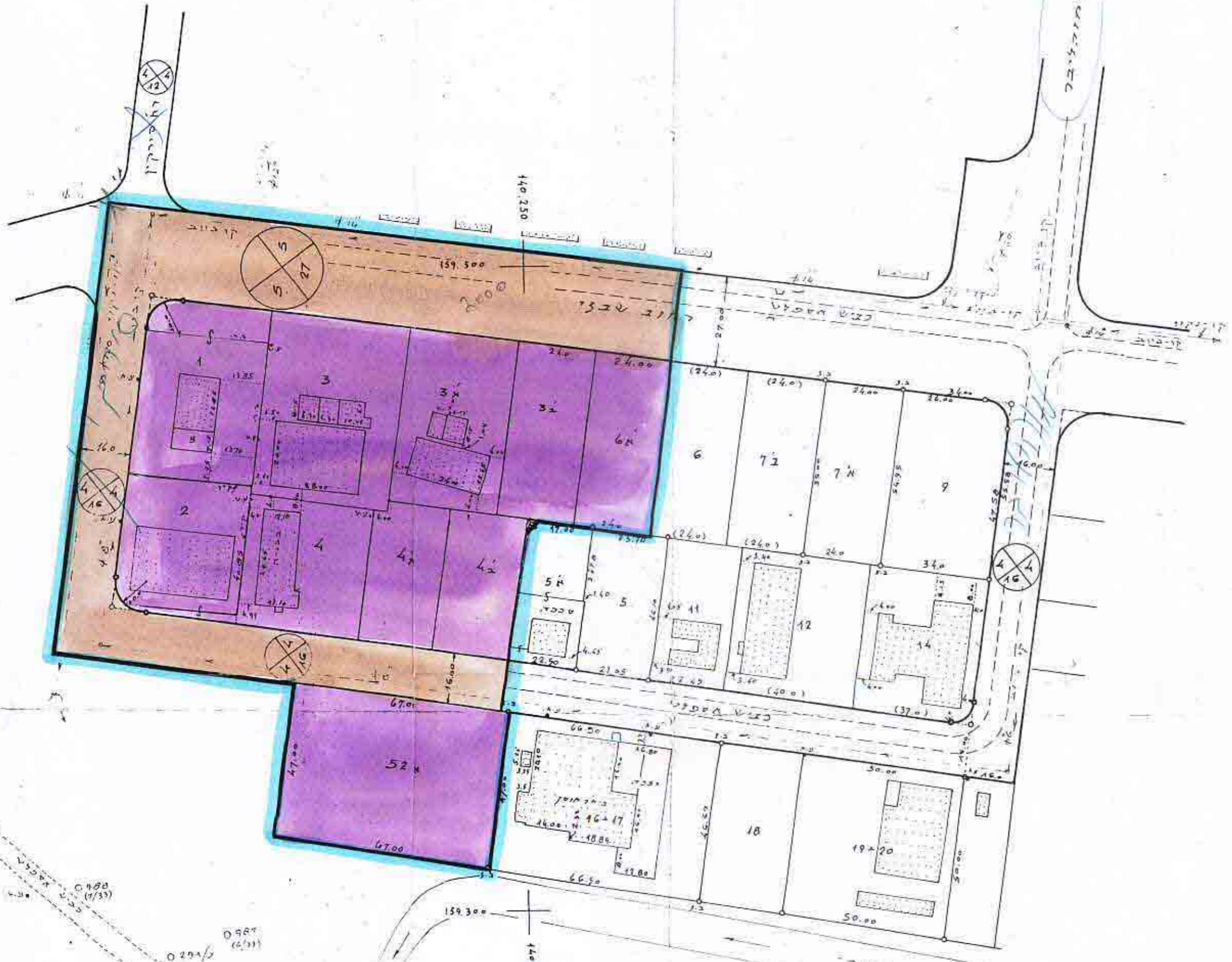
תרשים מצב מוצע 1:1250 (אזור התעשייה)

Handwritten signature and date: 13.11.77