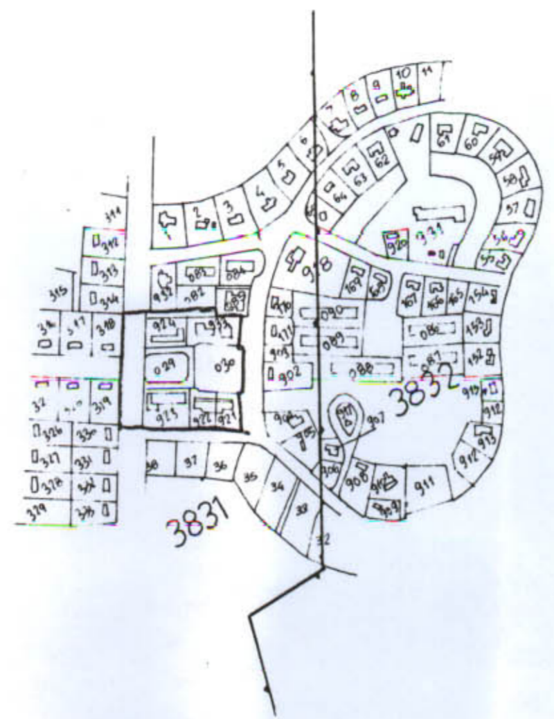
תרשים סביבה 1:5000