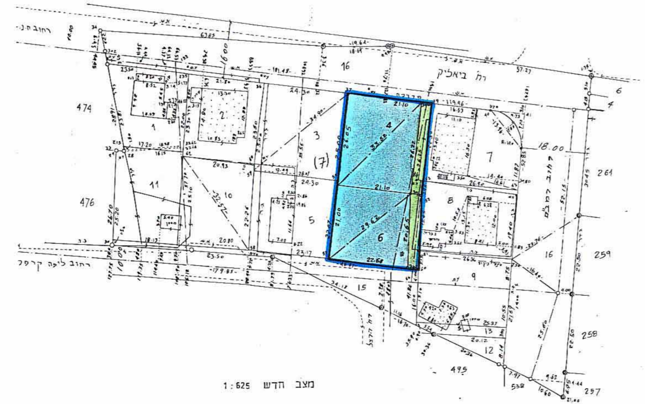
מצב חדש 1:625

חתימת יוזם ועורך התכנית יעקב רויטמן מהנדס מועצה מקומית גבעת-שמואל