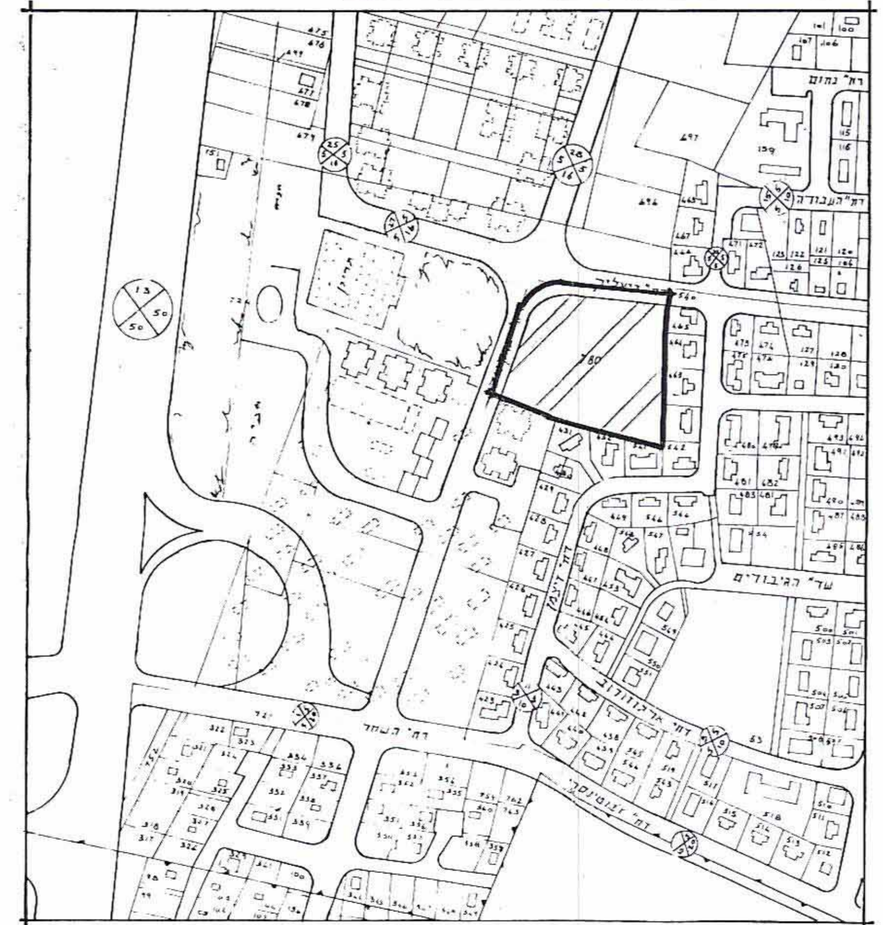
תרישים הסביבה (מצב קיים) קמ. 1:2500