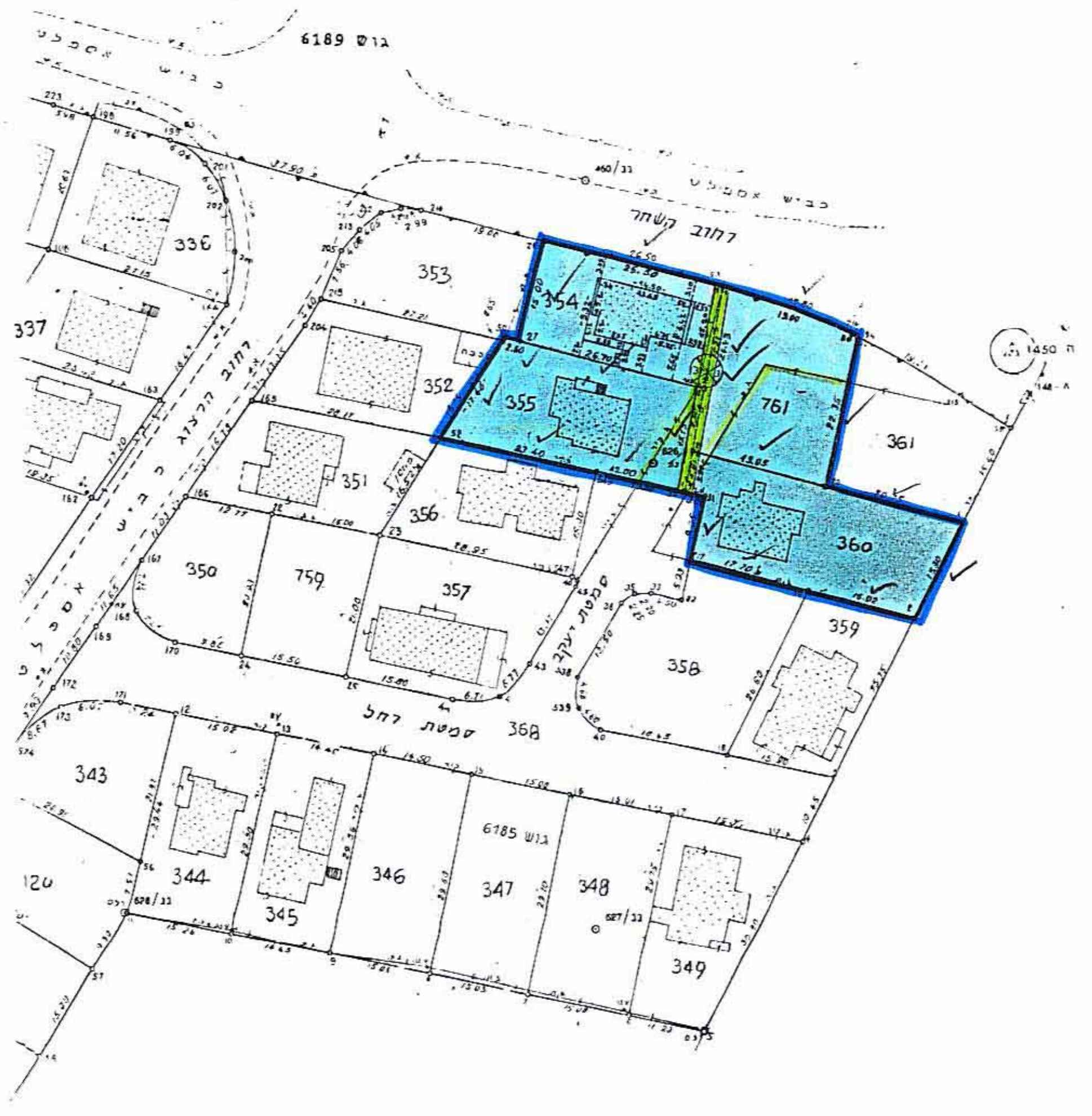
מצב חדש 1:625

תכנית מפורטת מס' מח/3026 שני לתכנית מס' מח/2/854 - מח/2/854