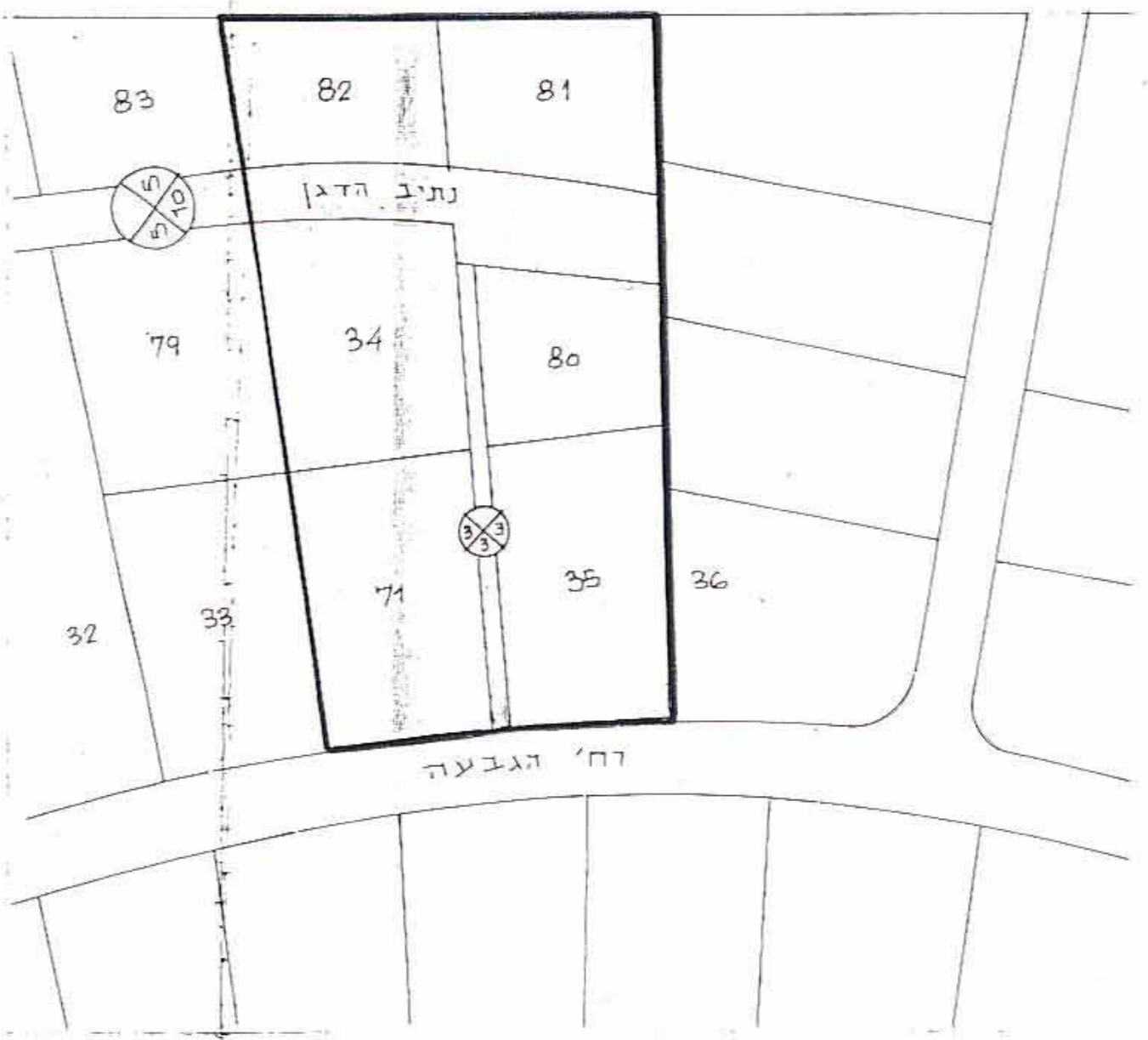
מצב קיים ק.מ. 1:1250