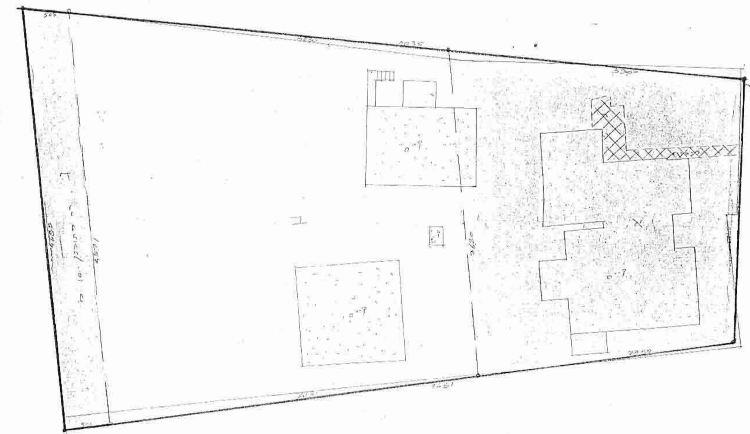
תנאים מוגדלים 1:250 מסב קיים