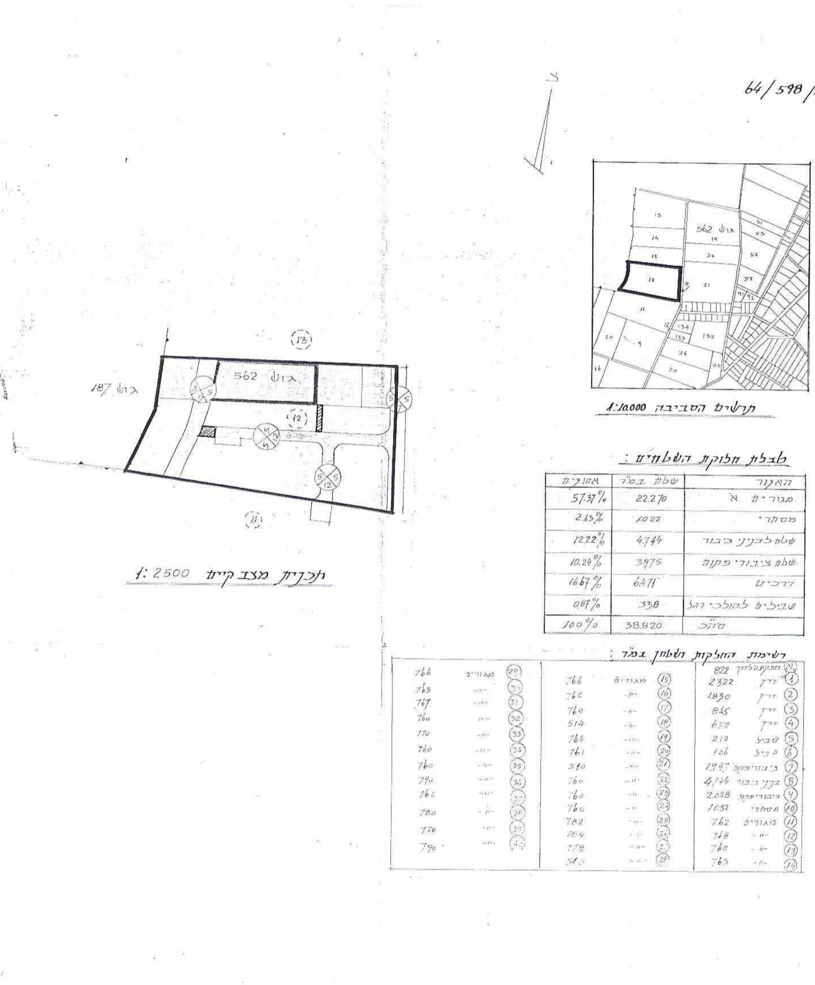
1:2500 תוכנית מצוטט