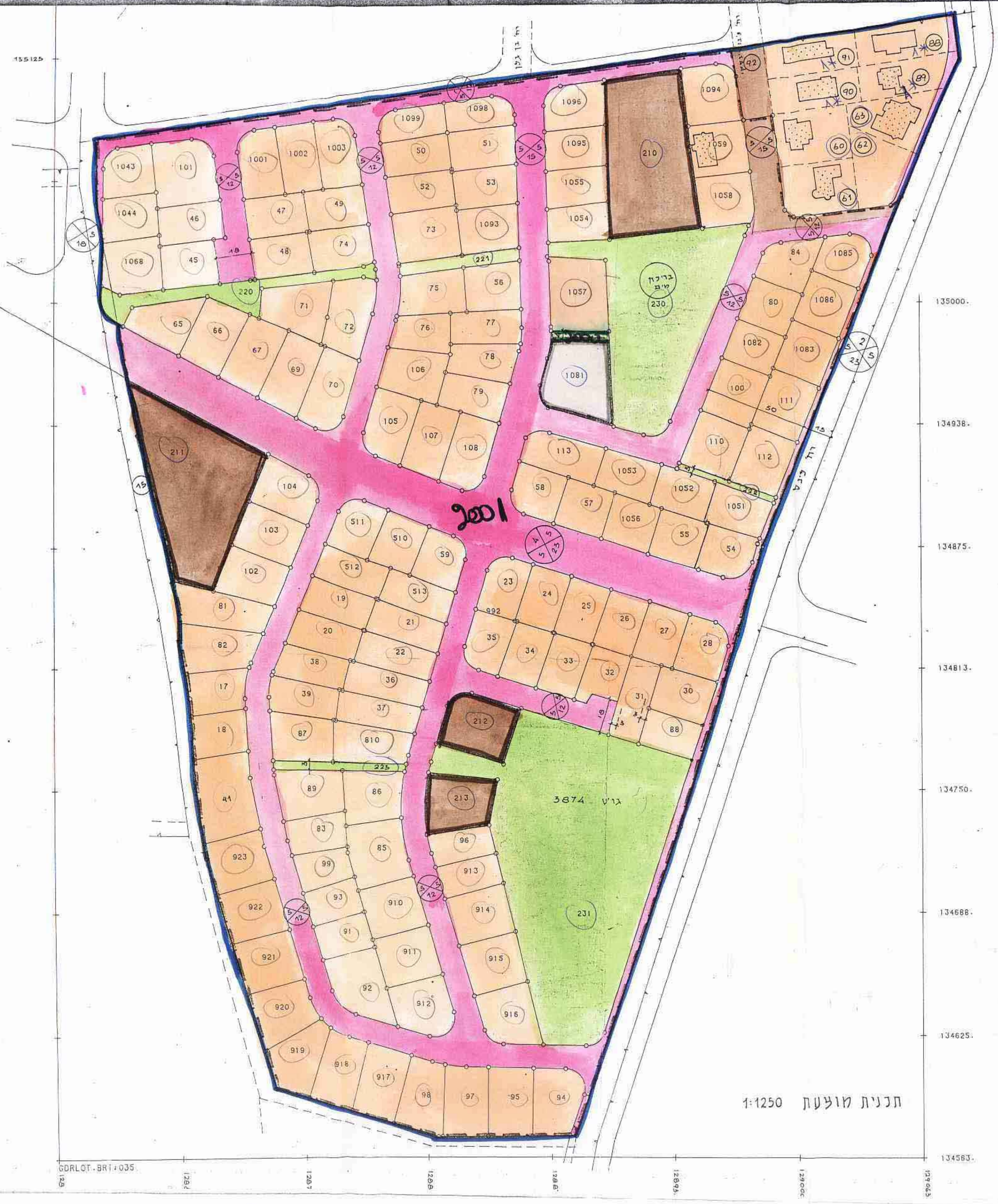
1:1250 תכנית מופעת