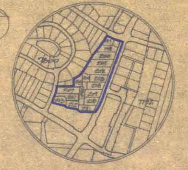
תרשים סביבה 1:12500

חתימת המבקש חתימת בעל הקרקע חתימת המתכנן