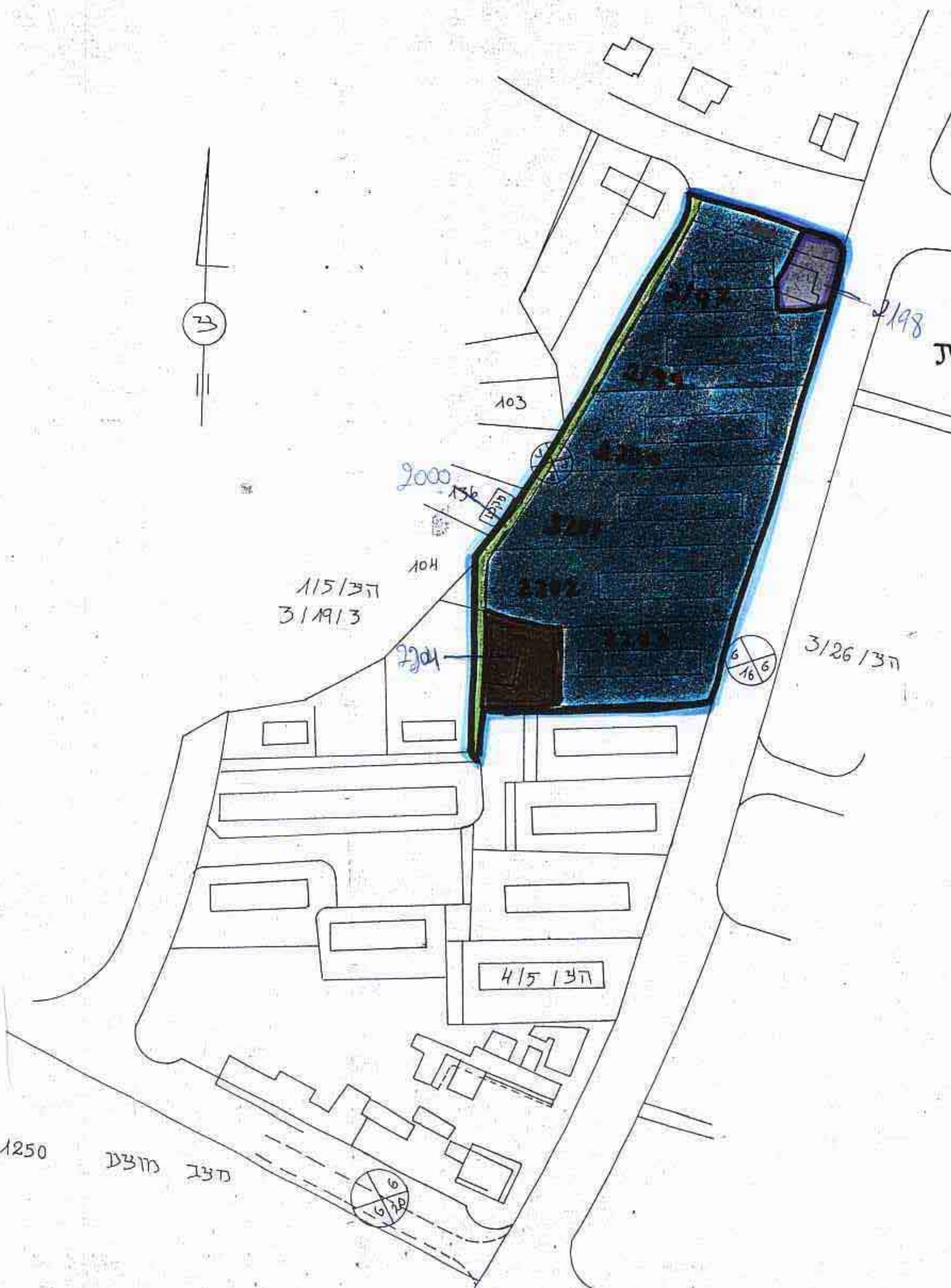
מלב מוצע 1:1250