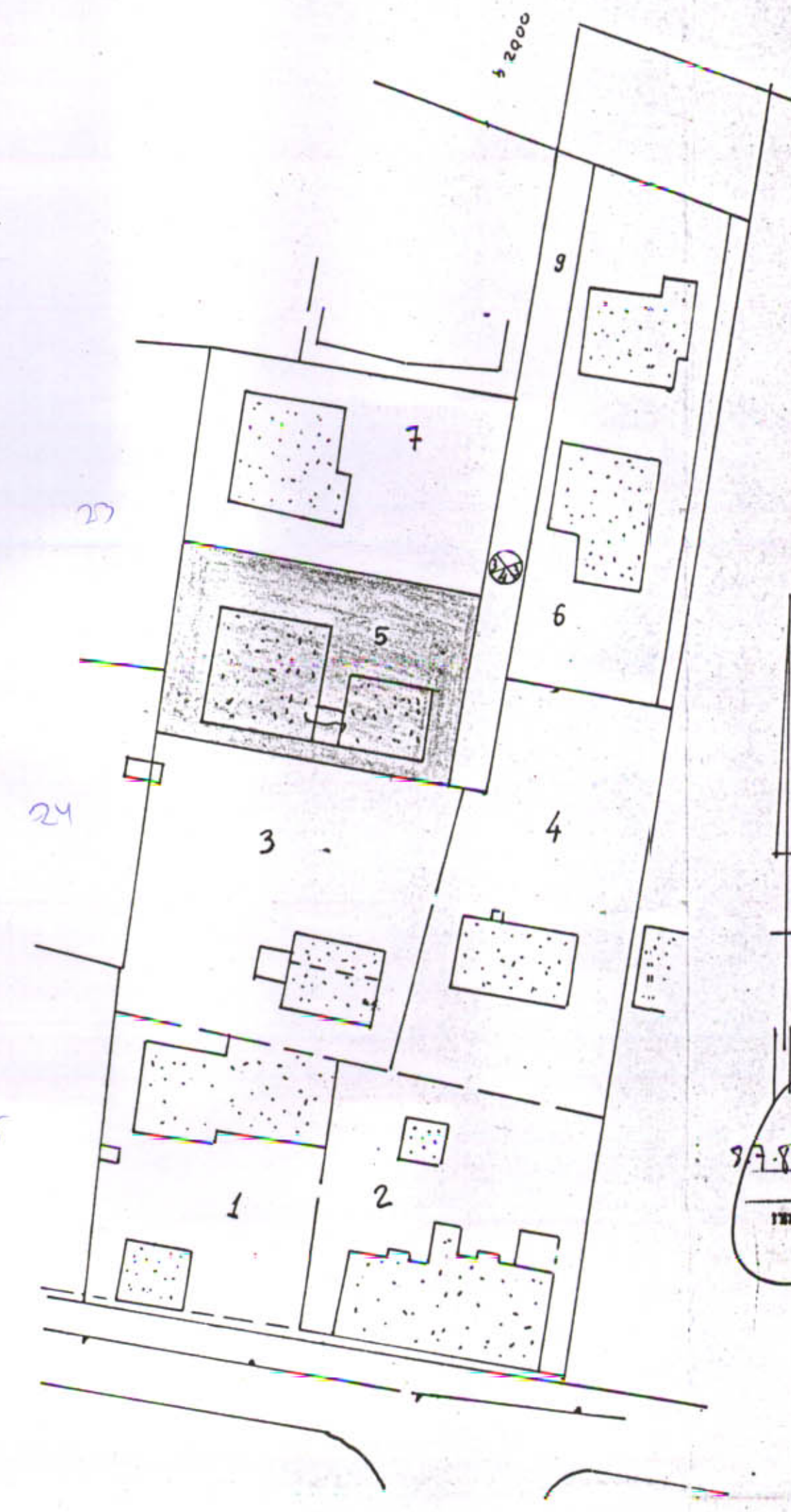
תרשים סביבה ק"מ 1:500