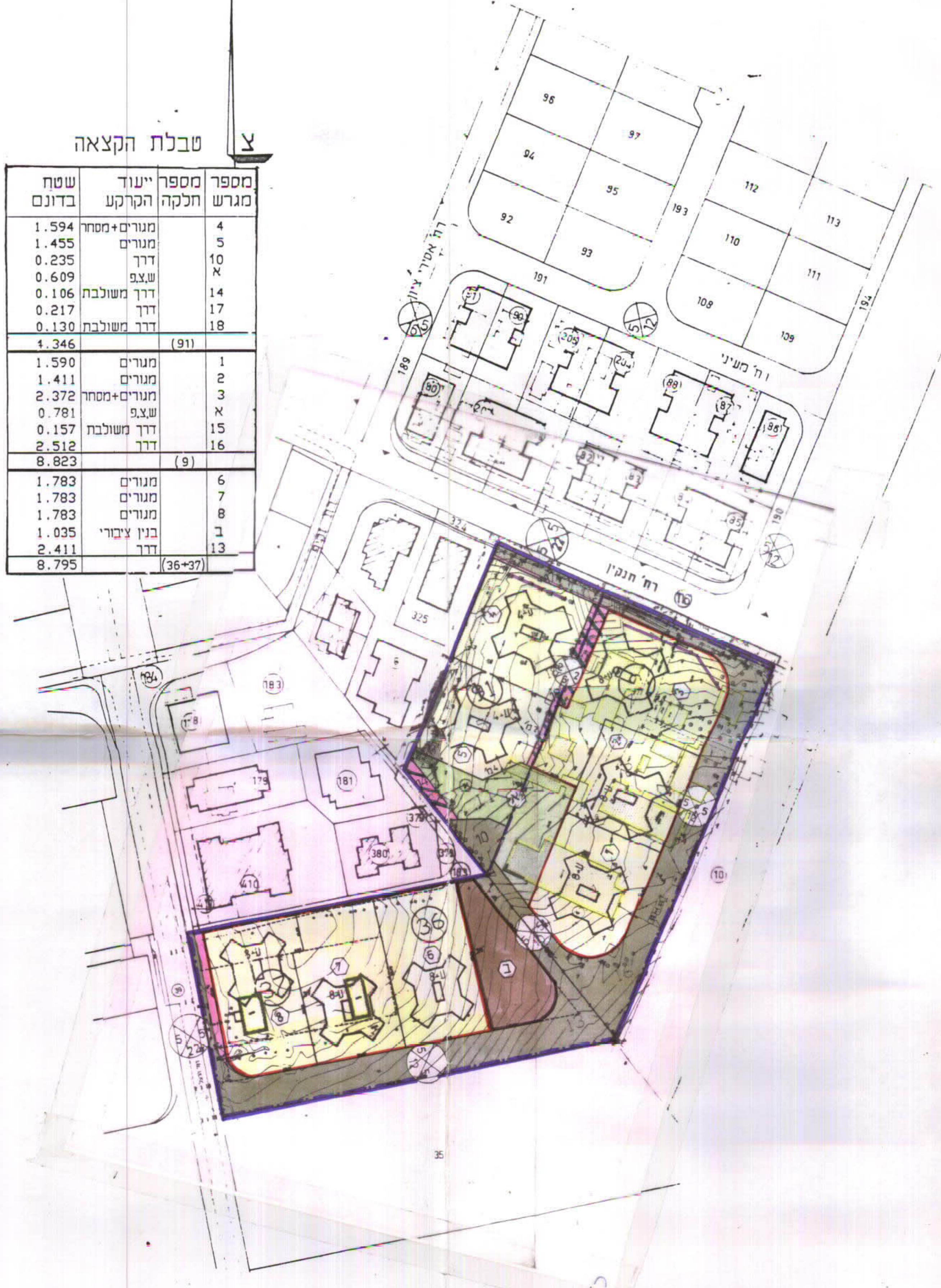
מצב מוצע ק.מ. 1:1000 התכנית ערוכה על דקת קפת מדידה