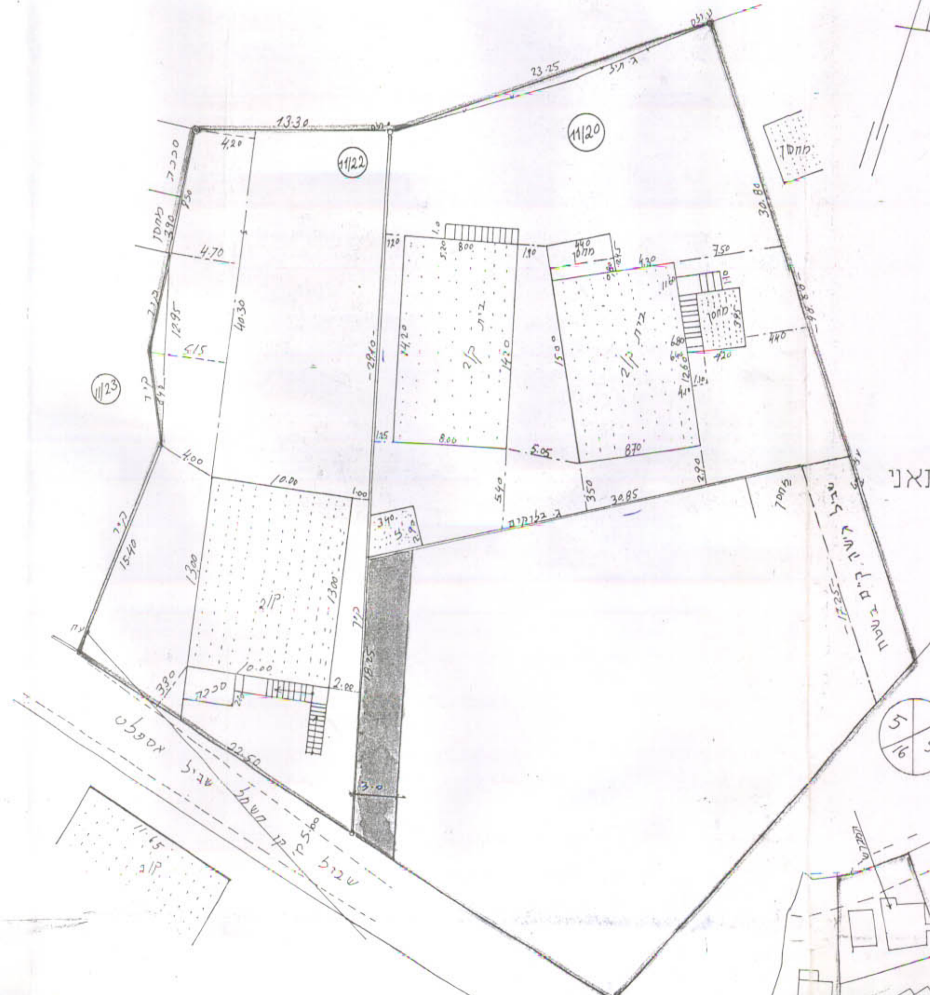
תרשים המגרש מצב קיים ק"מ 1:250