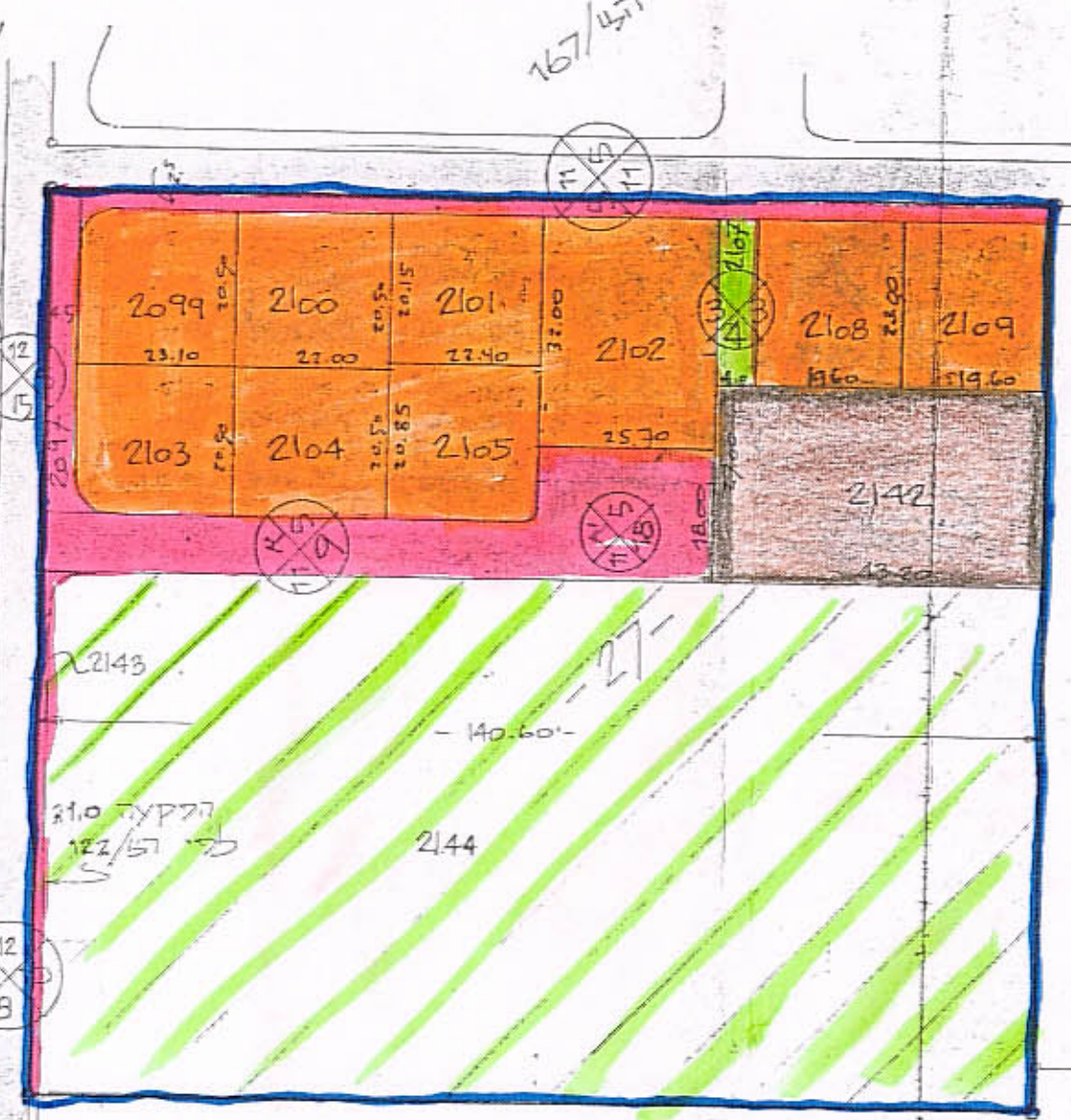
מלב קוטע 1:1000