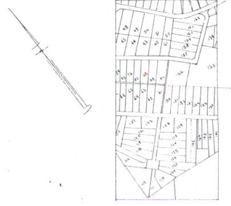
תרשים סביבה 1:5000