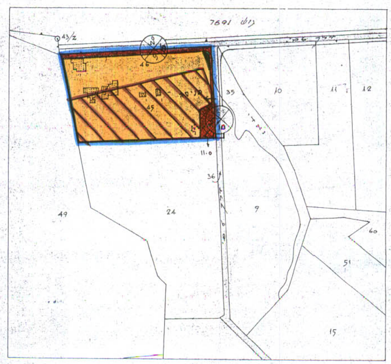
מצב חדש 1:2500