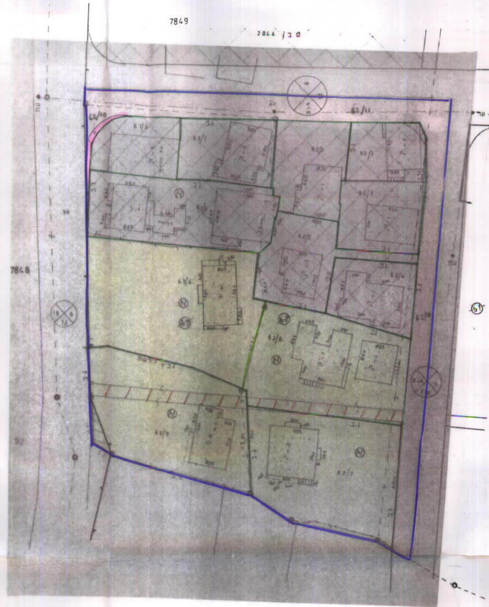
מצב מוצע קמ 1:500

הוק התכנון והבניה תשכ"ה - 1965 הועדה המקומית לתכנון ולבניה אל - טייבה اللجنة المحلية للتخطيط والبناء - الطيبه ו כנית מספר 2169 המלצה להפקדה בישיבה מס' 8/83 מיום 11-9-83 מהנדס הועדה יושב ראש הועדה