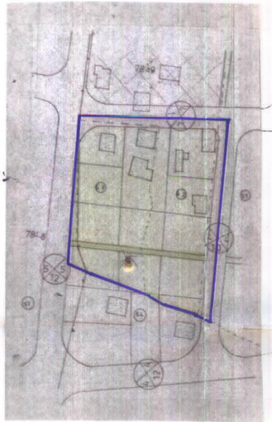
מצב קיים קמ 1:1250 כפי מס 842/8