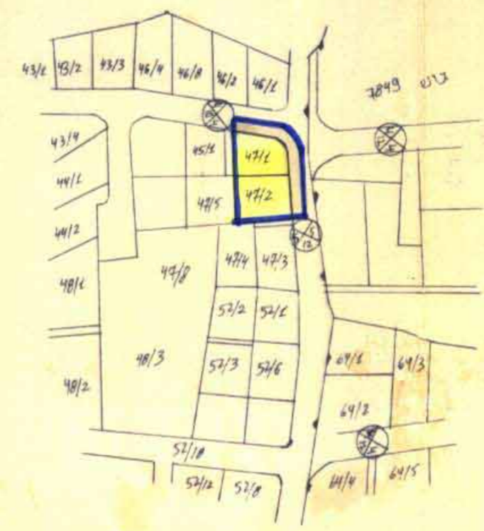
תרשים הסביבה קב: 1:2500