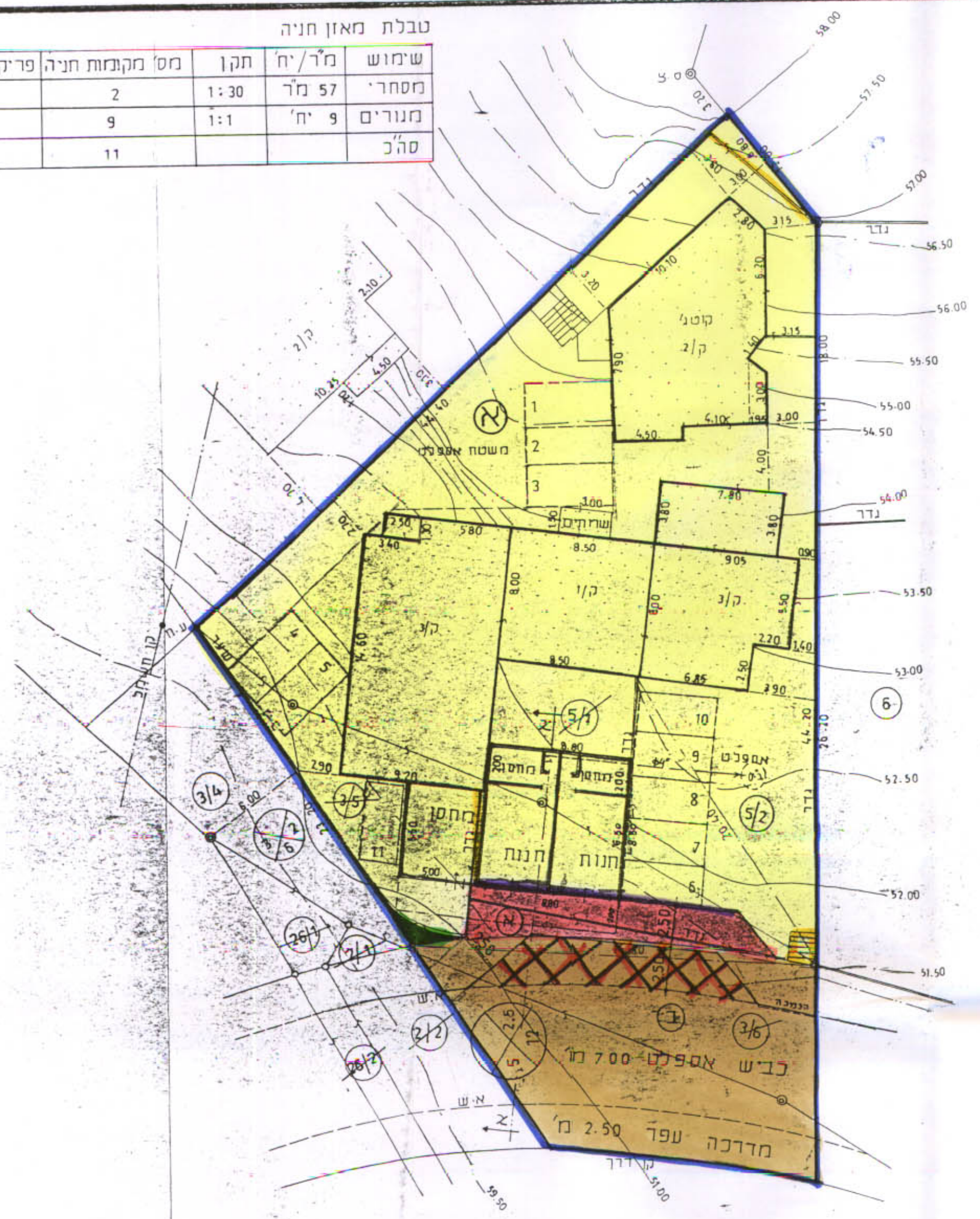
תרשים מצב מוצע 1:250