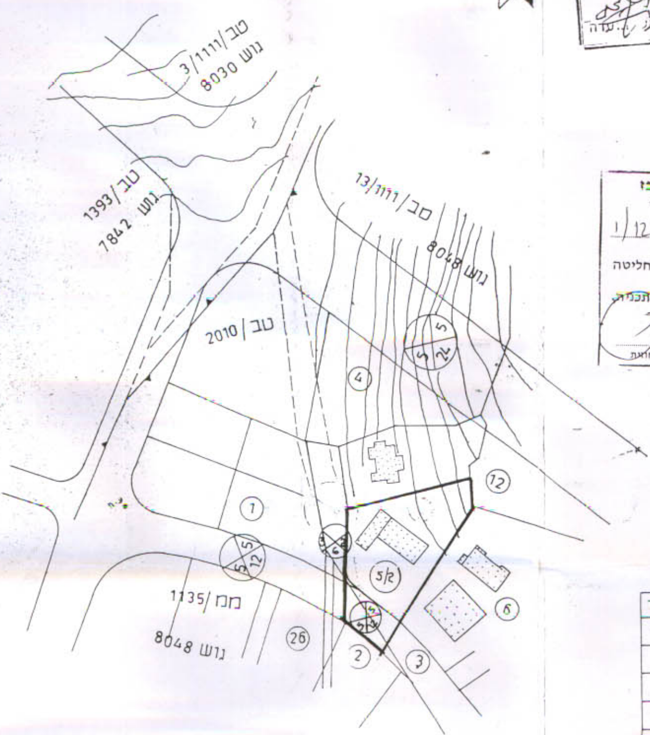
תרשים מצב קיים 1:1250

מרחב תכנון מקומי אל-טייבה תכנית מפורטת מס' 1/1213 שינוי לתכנית מס' 25/560+1213 ב' ק"מ 1:250