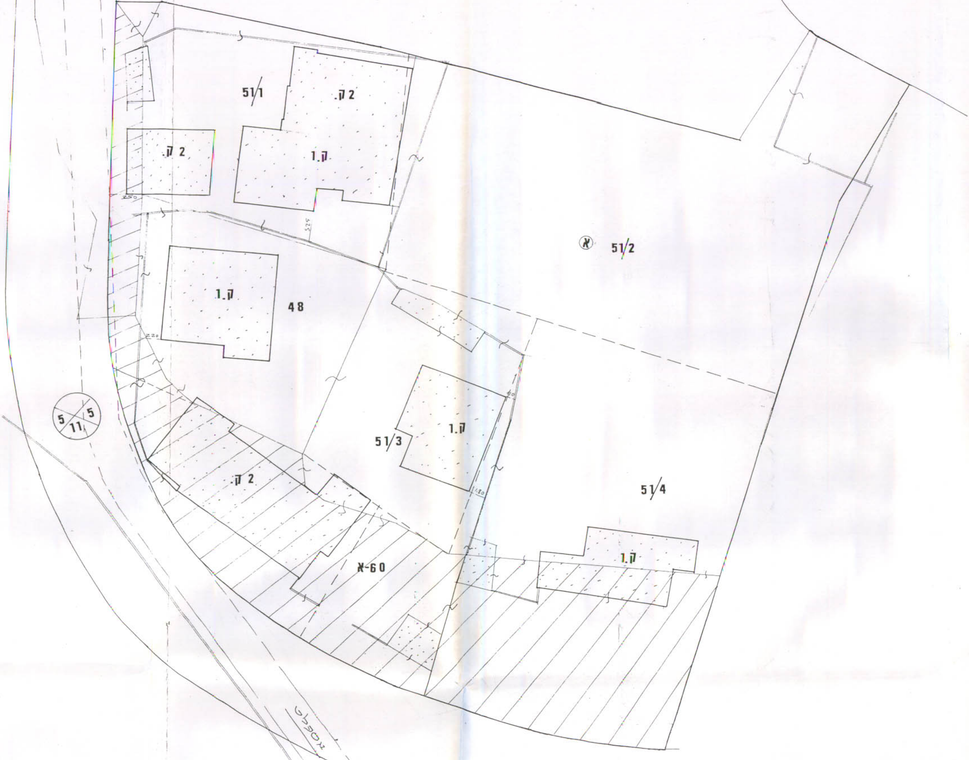
טבלת שטחים, מצב חדש