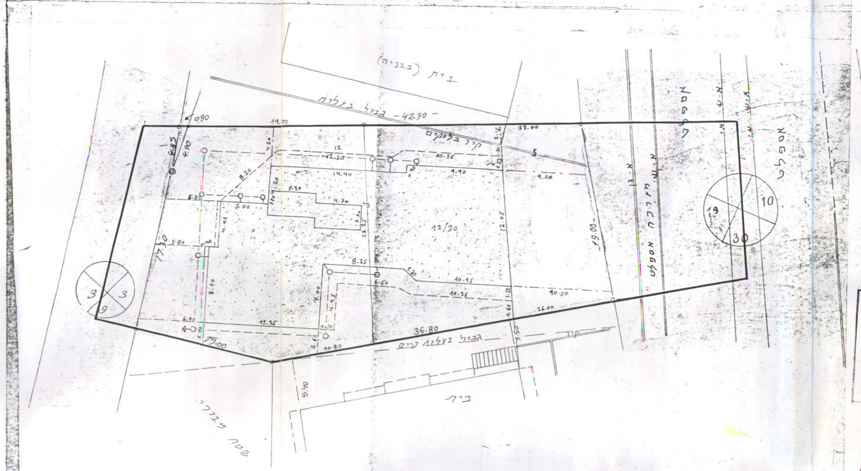
תרשים המגרש קיים (ישן) 1:250