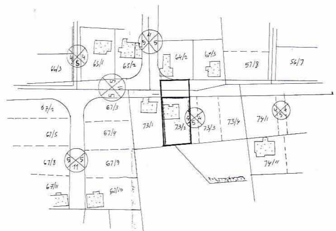
מצב קיים - ק:ם : 1-250