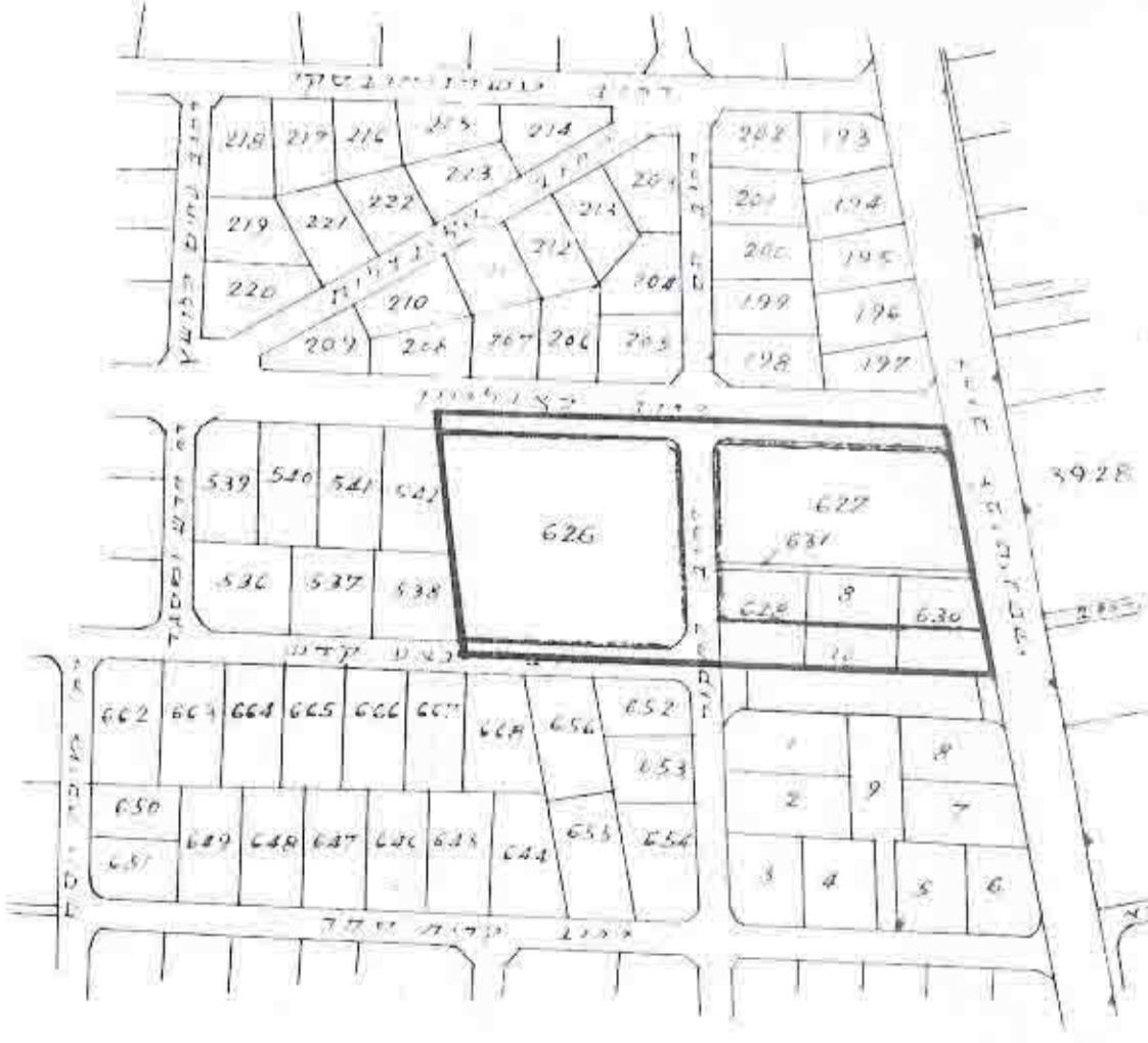
תרשים הסביבה קנה 1:2500