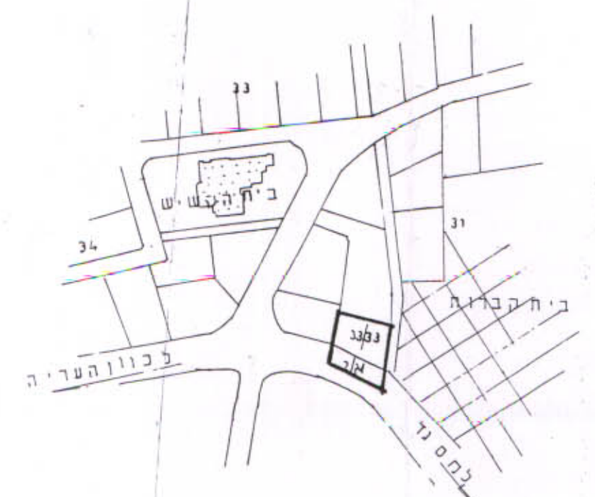
מצב קיים לפי מח/מ/25/560 ק.מ. 1:2500