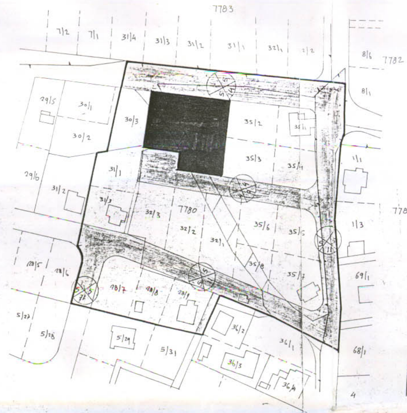
תרשים מצב קיים ק.מ. 1:1250