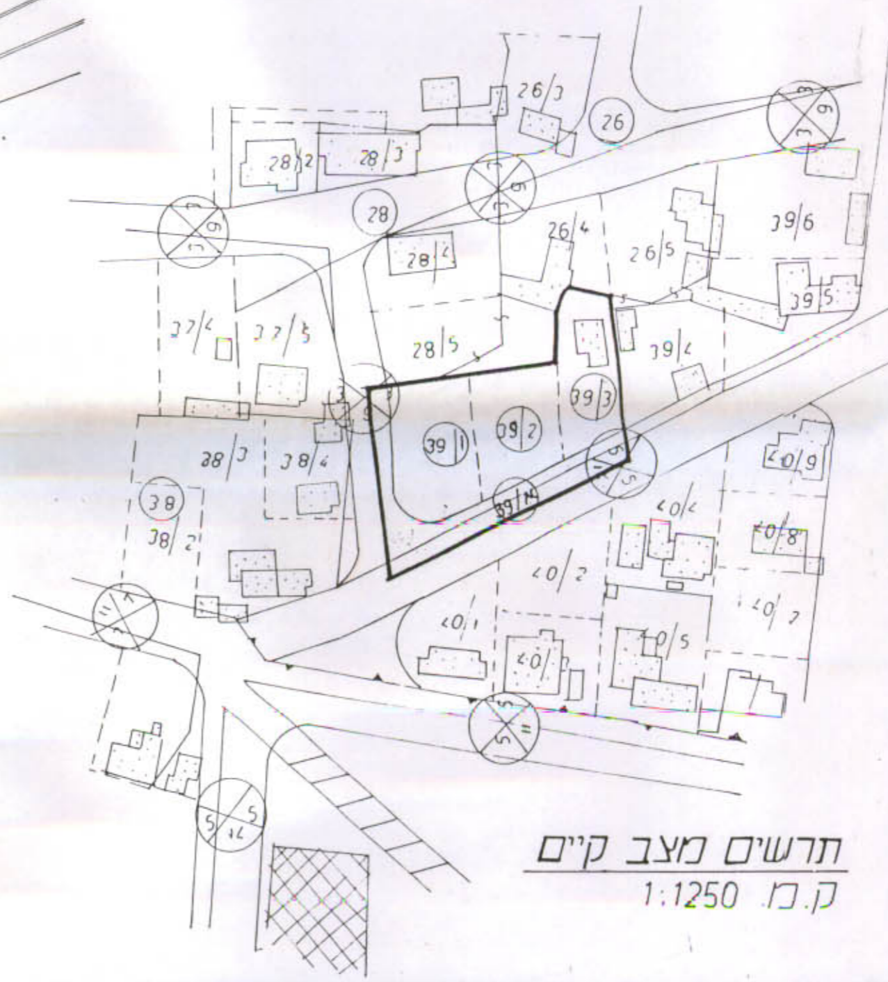
תרשים מצב קיים ק"מ 1:1250