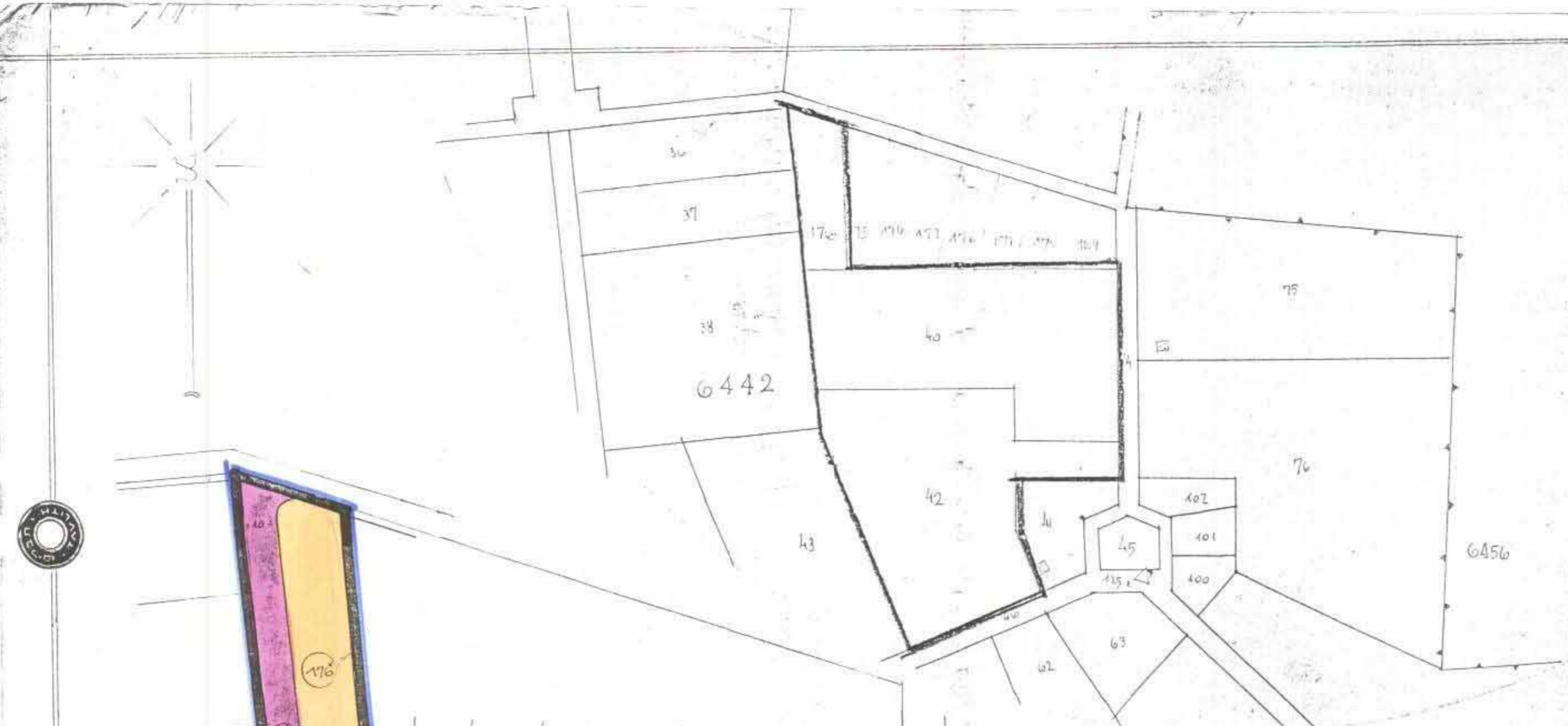
תרשימם המקומים 1:2500

מחוז תל-אביב נפה : כפר : גוש מס' : חלקה מס' : שטח התכנית : בעל הקרקע : המבצע : הכותב : א. שוויצקי תא רה הרצל א