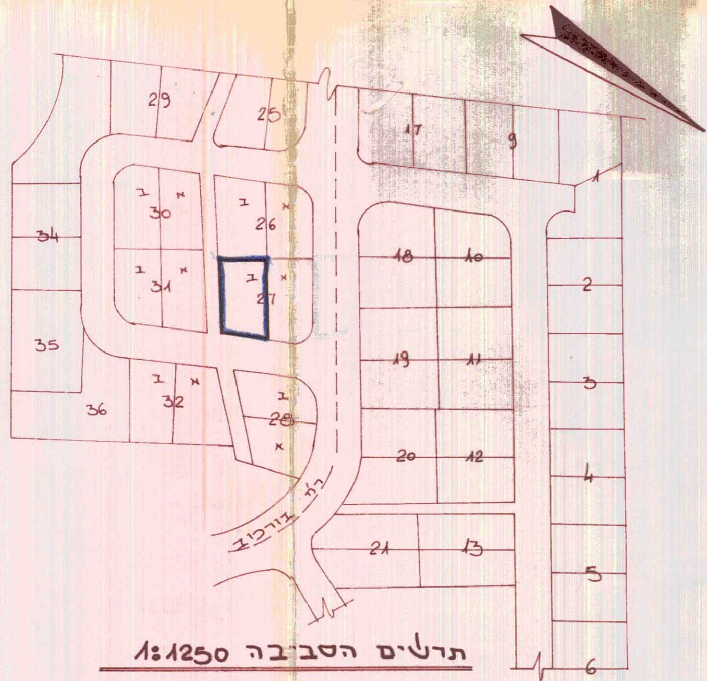
תרשים הסביבה 1:1250