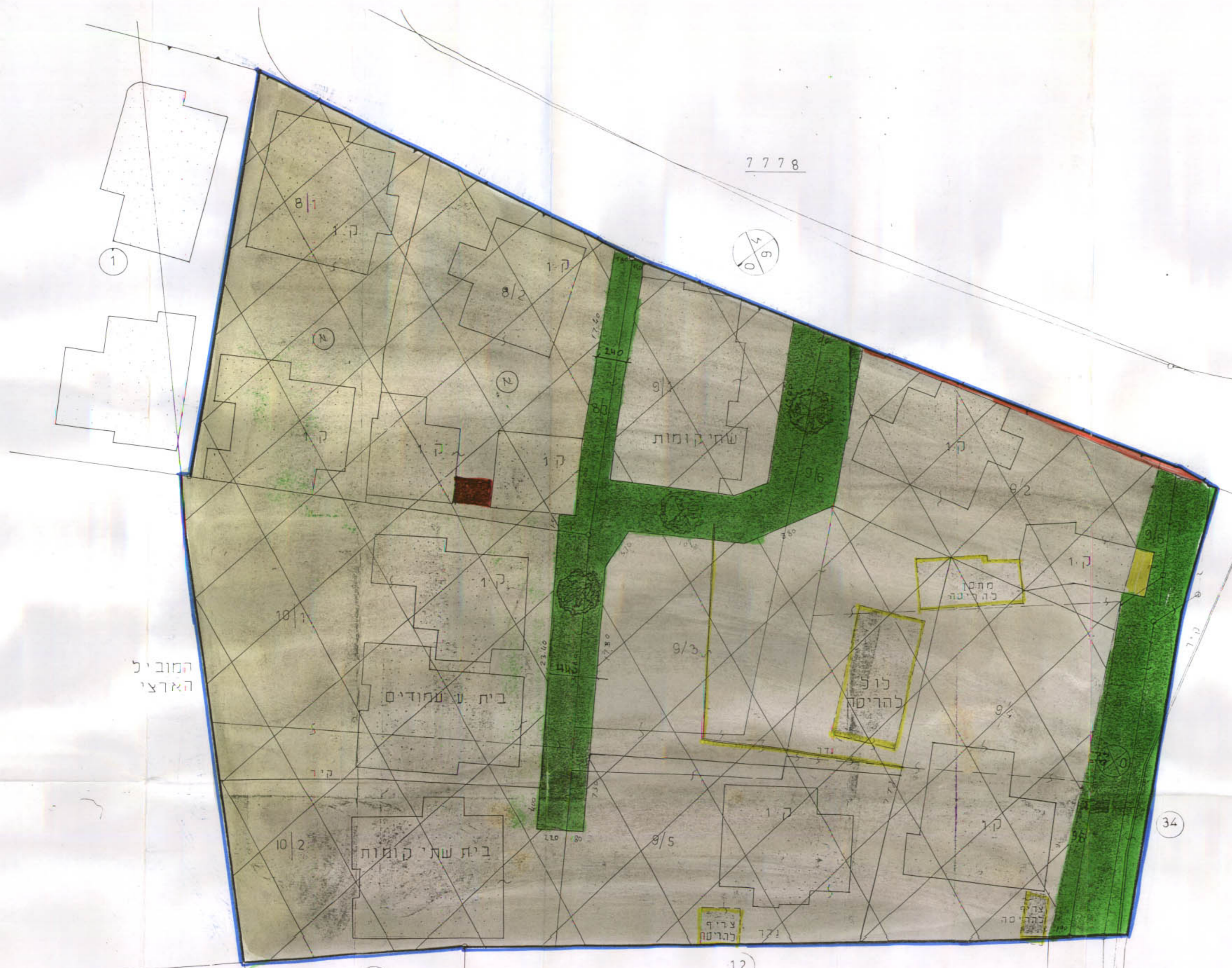
מצב חדש ק"מ 1:250