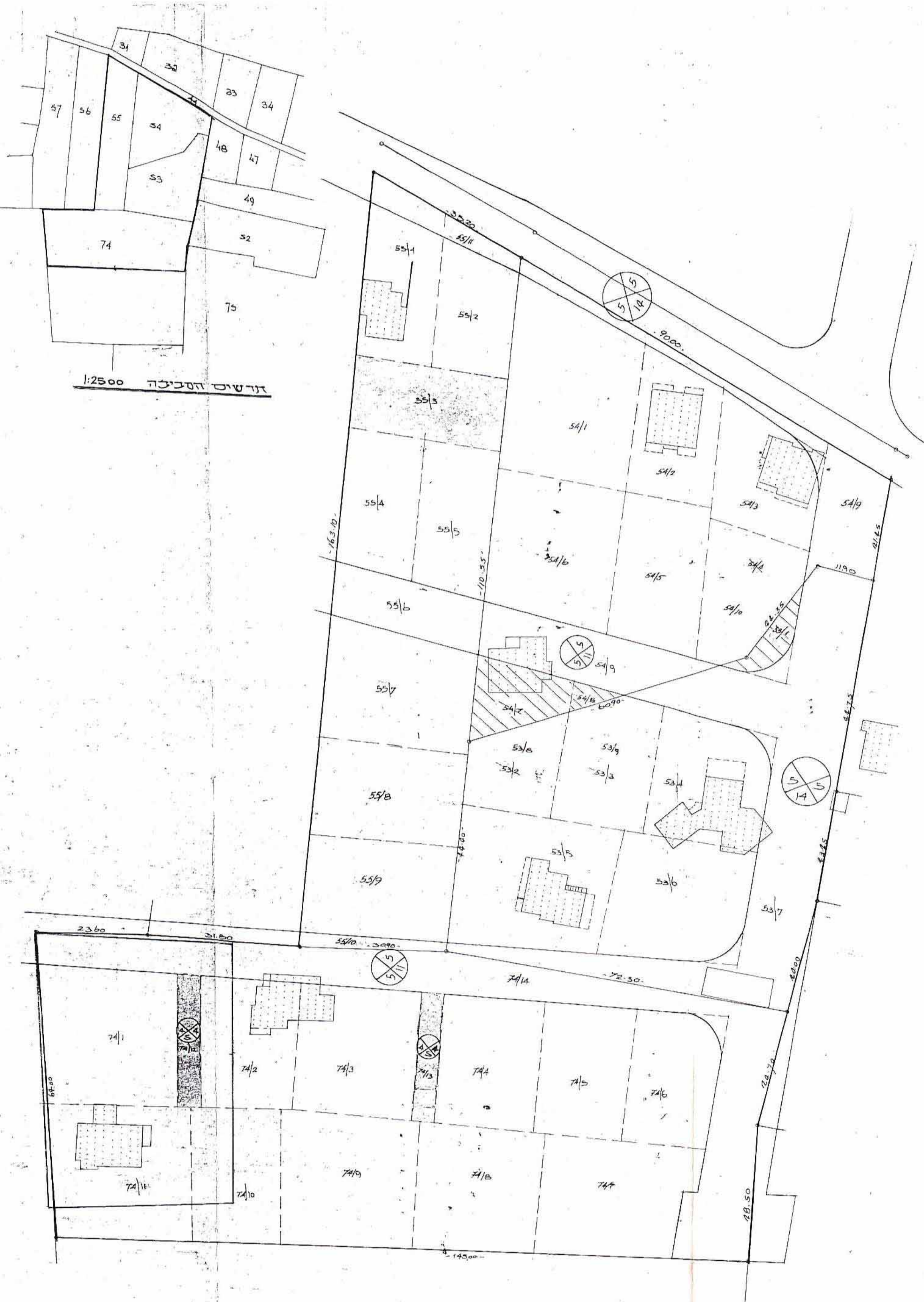
מצב קיים 1:500