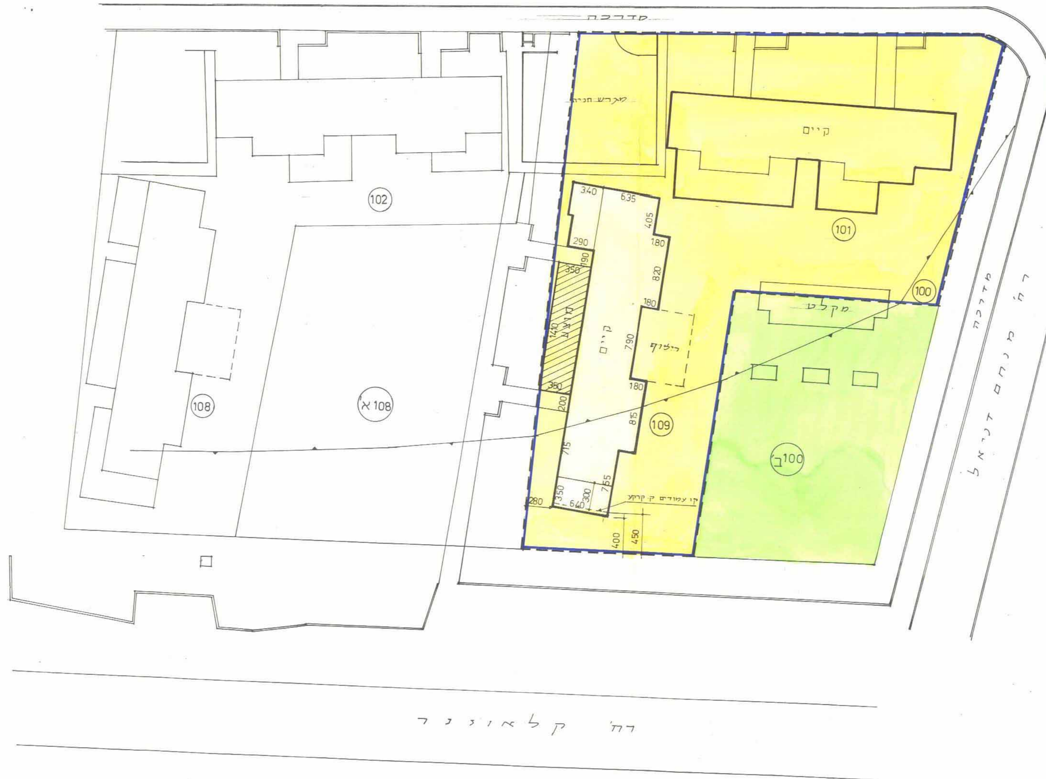
תכנית מצב מוצע ק.מ. 1:250